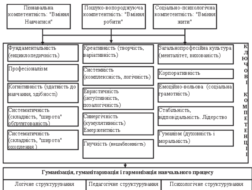
Рис. 3. Структура моделі сучасного менеджера з природоохоронної діяльності

едність інтелектуального розвитку з формуванням особи, здатність справлятися з суперечностями й невизначеністю життєвого досвіду; здатність самостійно контролювати хід свого інтелектуального розвитку і досягати висот професійної майстерності і творчості; структуризація знань, ситуативно-адекватна актуалізація знань, розширення, нагромадження знань, спрямованих на заощадження ресурсів, екологічну безпеку; адекватна оцінка досягнутих у саморозвитку результатів і постановка нових перспективних завдань з розвитку екологічних знань і технологій управління.