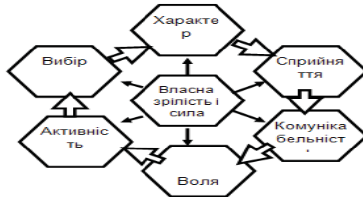
Рис. 1. Особисті властивості сучасного менеджера з природоохоронної діяльності

Важливою групою знань сучасного менеджера є базові знання. До цієї групи знань належать особисті властивості менеджера в природоохоронній сфері: інтелектуальні, волевові, емоційні, етичні, комунікативні. Сучасний менеджер повинен мати риси, які посилюють довіру і повагу з боку співробітників. Слід також особливо зазначити окремі базові знання сучасного менеджера, які насправді є фундаментом усієї управлінської діяльності менеджера. Ці знання водночас з особистими властивостями є особливою силою самого менеджера і містять декілька складових (рис. 1).