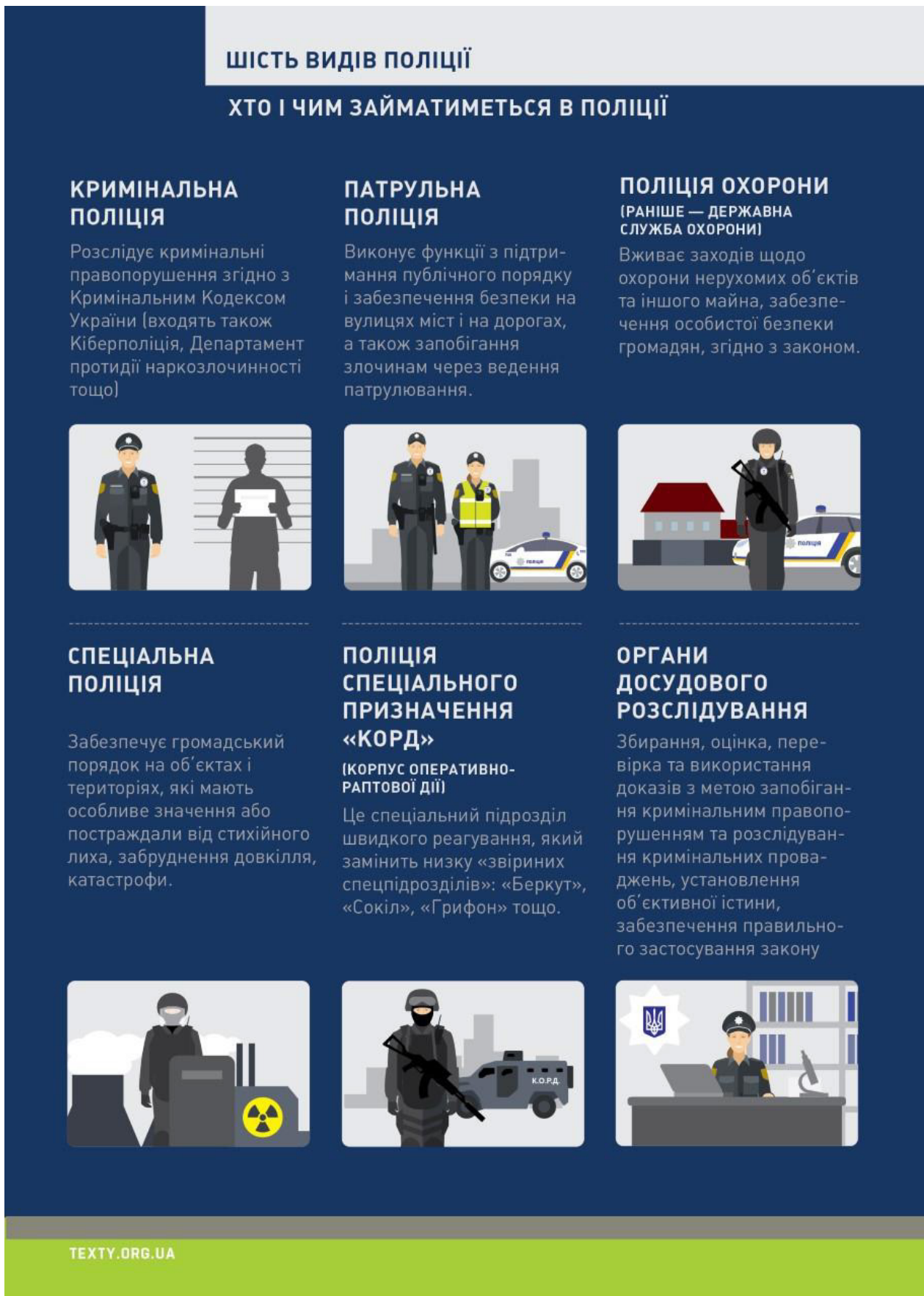
Рис. 2. Приклад постера