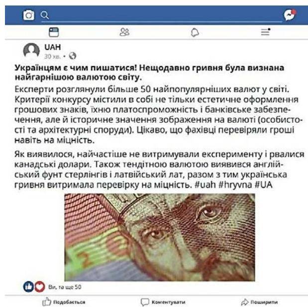
Рис. 4. Приклад допису в Facebook

Висновки. Вміння протистояти негативним інформаційним впливам і маніпуляціям; шукати, аналізувати й обробляти медіаконтент; створю-