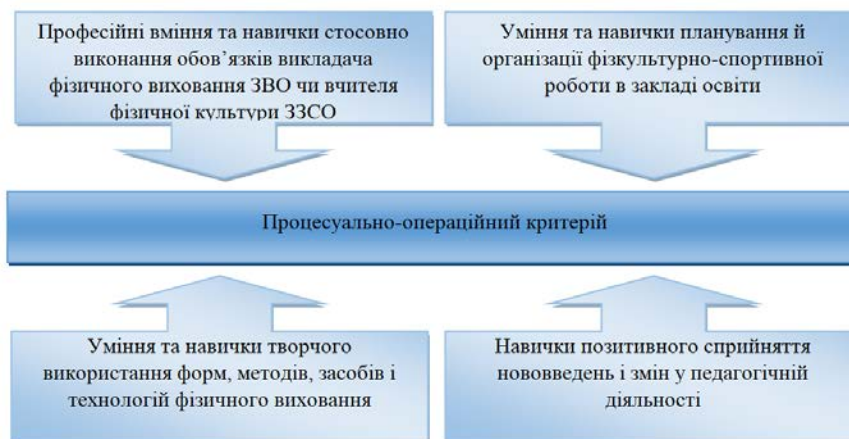
Рис. 3. Показники процесуально-операційного критерію

вміннями та навичками творчого використання форм, методів, засобів і технологій фізичного виховання; помітними навичками позитивного сприйняття нововведень і змін у педагогічній діяльності.