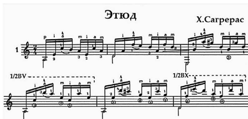
Рис. 2. Етюд a-moll

Як більш складний приклад розглянемо віртуозну мініатюру «Колібрі», яку і сьогодні можна назвати найбільш відомим та популярним серед виконавців твором. Вона, поряд із багатьма етюдуну, входить як до обов'язкових навчальних і екзаменаційних, так і до конкурсних програм. Твір містить поєднання кількох видів техніки: репетиції, легато, місцями гамоподібні пасажі й арпеджію. Складність виконання етюдуну полягає в постійному контролі над правою рукою для рівномірного звуковидобування за багатократного повторювання у швидкому темпі однієї ноти на одній струні. Дрібна техніка репетиції імітує швидкий рух маленьких крилець колібрі, різкі зміни позиції та переміщення по грифу повторюють стрибки пташки в повітрі (рис. 4).