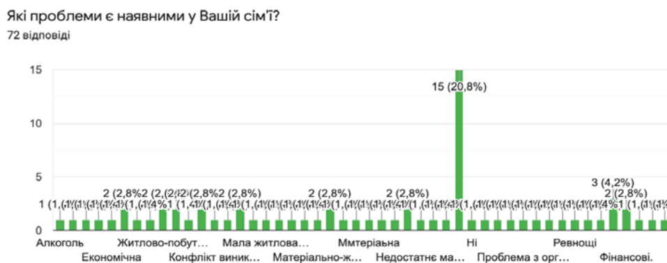
Рис. 2. Відповіді на запитання «Які проблеми наявні у Вашій сім'ї?»