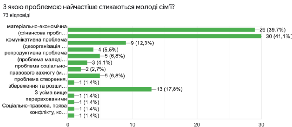
Рис. 1. Відповіді на запитання «З якою проблемою найчастіше стикаються молоді сім'ї?»

Тому за цим питанням можна зробити висновок, що в молодих сімей найбільш вираженою є матеріально-економічна, житлово-побутова та проблема появи конфлікту. В деяких сім'ях є кілька