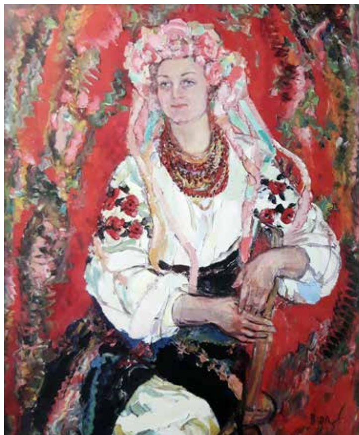
Іл. 7. В. Барінова-Кулеба. Оленочка. Полотно, олія. 104х92. 2000 р.