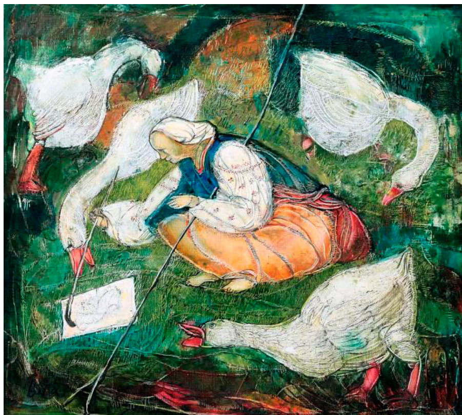
Іл. 4. В. Барінова-Кулеба. Автопортрет з гусьми. Полотно, олія. 60x70. 2009 р.