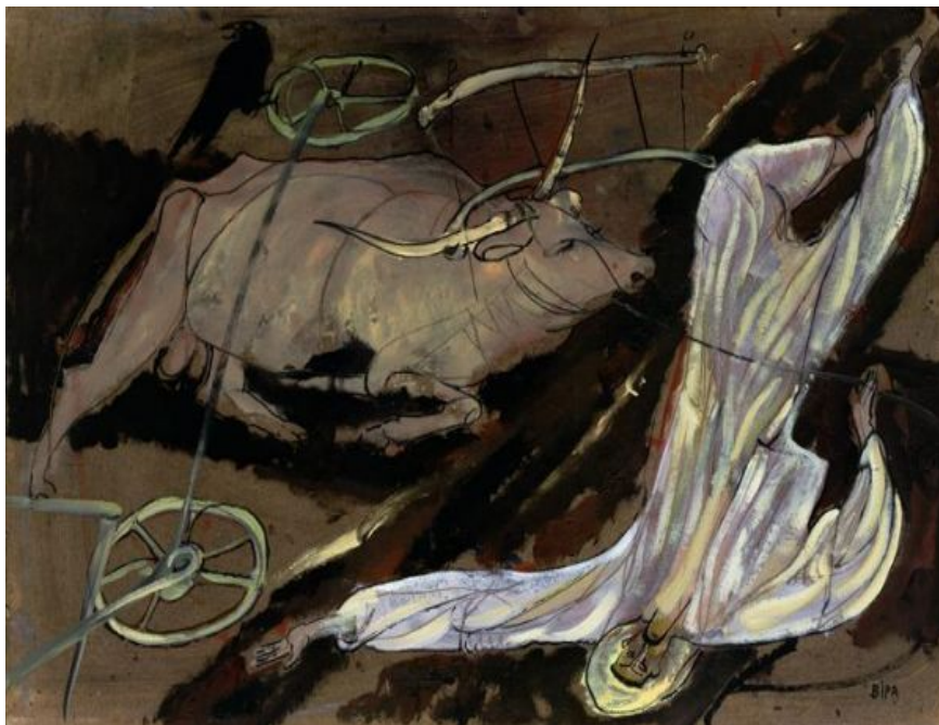
Іл. 6. В. Барінова-Кулеба. Тридцять третій рік. Полотно, олія. 40х60. 1998 р.