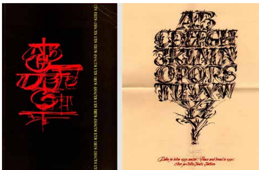
Рис. 2. Зразок обкладинки книжки і каліграфічна робота Villu Toots

Сучасний леттерінг є важливим елементом потужних графічних проєктів із брендингу та айдентики, а отже, студентам доцільно вивчати кращі зразки, створені майстрами. У студентів, майбутніх графічних дизайнерів, важливо виховувати повагу до традицій минулого і сміливість, що дасть змогу створювати нове у сфері шрифтової графіки.