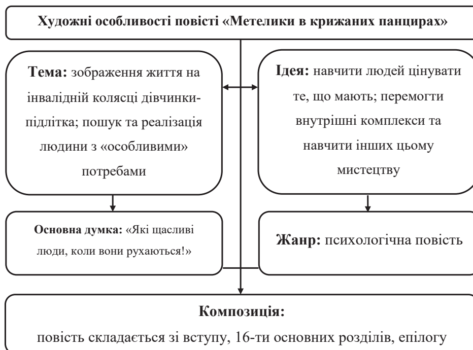
Рис. 2. Художні особливості повісті «Метелики в крижаних панцирах»