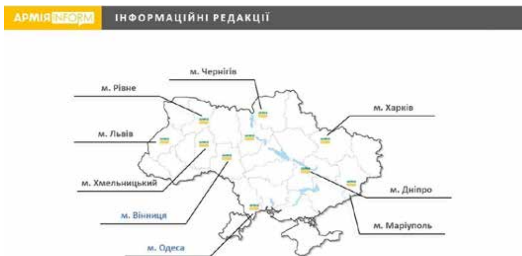
Схема 1. Історична довідка Інформаційної агенції (Історична довідка, 2022)

У підпорядкуванні Інформаційної агенції – інформаційні відділи, колишні медіа-центри, які були у складі газети «Народна армія». Відтак, представництва зосереджені наступним чином: