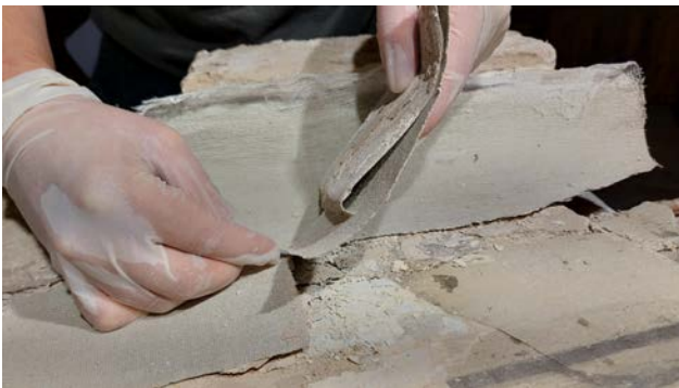
Рис. 6. Процес зняття з живопису захисного шару марлі

У ході розчисток відкрився авторський живопис, це дало змогу провести його атрибуцію. Відшарований живопис це частина карнизу, який знаходився між станами та стелею. Живопис виконано клеєвими фарбами та мають кутову форму. Авторський живопис виконано у декілька прийомів. Спочатку наносився як підклад темно-оливкового кольору, потім вугіллям наносився малюнок майбутнього живопису, а зверху нанесено фактурний шар основного живопису. Зображено орнаментальний фриз з рослинними мотивами та гірляндами.