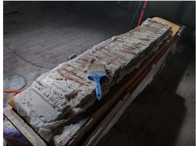
Рис. 2. Процес потоншення авторського тиньку

щувались таким же складом суміші тільки клей використано ПВС «японія». Для додаткової міцності клеїлась медична марля, між третім та четвертим шарами реставраційного «тиньку». Після повного висихання реставраційної основи, проводилась робота над лицевою стороною «трансферу» (рис. 4).