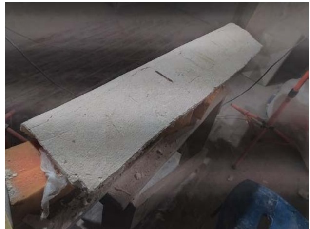
Рис. 3. Загальний вигляд тильної сторони живопису після потоншення авторського тиньку