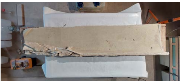
Рис. 1. Відшарований фрагмент живопису

Перед розшаруванням поверхню малярства заклеїли декількома шарами японського паперу, а у якості клею використано 10% Klucel G. Після повного висихання паперу наклеєно ще два шари медичної марлі у якості додатково армування, клей також використано 10% Klucel G. Живопис розшарували від первинного зображення сухим методом «strappo» (рис. 1).