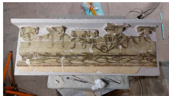
Рис. 9. Загальний вигляд відшарованого різночасового малярства на новій основі «трансфер»