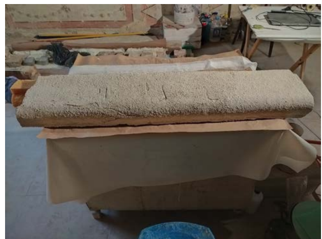
Рис. 4. Етап нарощування нової основи «реставраційного тиньку»