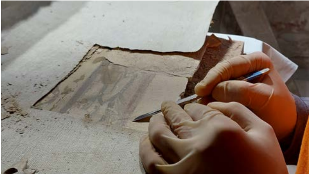
Рис. 5. Процес очистки живопису від різночасових шарів побілок

Після зняття з лицьової сторони медичної марлі та японського паперу, встановлено, що відшарований живопис зверху має сім шарів побілки. Усі шари побілки мають різний колір та відносяться до радянського періоду (рис. 5, 6).