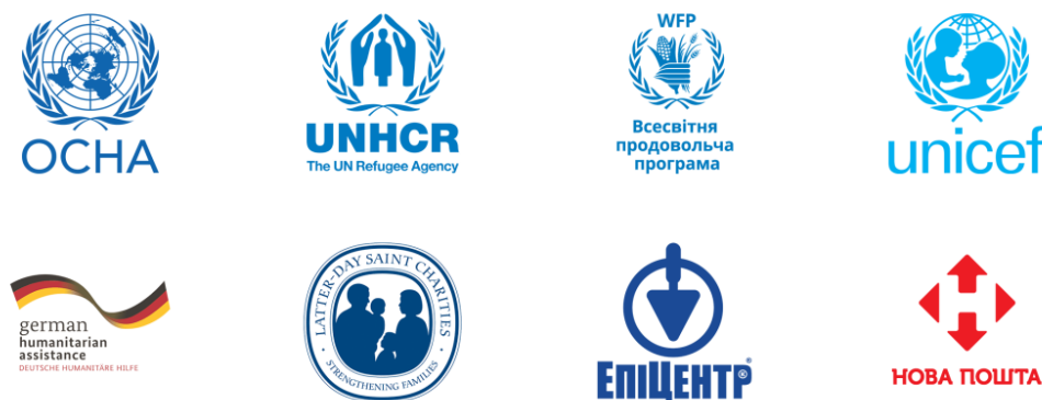
Рис. 4. Організації з якими ADRA має тісну співпрацю (ADRA Ukraine)

Щоб зрозуміти характер змін, потрібно поглянути на діяльність до війни. ADRA продовжувала безперервну роботу на сході України і навіть у так званих «сірих зонах». Постійно відбувалося забезпечення чистою водою місцевих сільських рад, шкіл, громад міст від Маріуполя до Мар'їнки та уздовж лінії розмежувань. Були відновлені труби, встановлено станції фільтрації, відновлено школи, санвузли, тощо. ADRA намагалася забезпечити постраждалих жителів вугіллям, гігієніч-