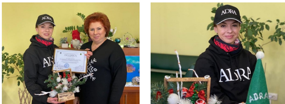
Рис. 1. ADRA отримала подяку від голови Новобаварського району Харківської міської ради Тетяни Цибульник за систематичну благодійну допомогу та чуйне ставлення до людей (ADRA Ukraine отримала, 2023)

ракетних атак та нападів існує велика ймовірність повторної руйнації, тому проводяться середні або малі ремонтні роботи.