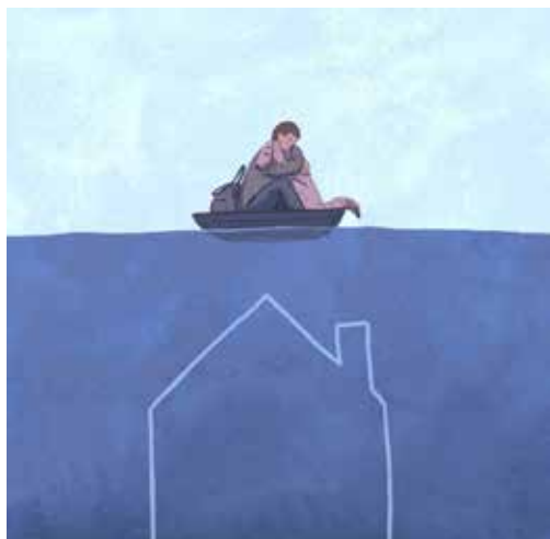
Рис. 9. Ілюстрація наслідків підриву Каховської електростанції, невідомий автор

Героїзм військових та медиків часто втілюється в міфічних образах янголів з сяючими крилами, які бережуть та рятують Україну, її народ. Така ілюстрація підкреслює відданість та відвагу сучасних «лицарів світла», які готові вистояти та захищати свою країну попри небезпеку власному життю (рис. 6). Зазвичай дизайнери в цьому випадку працюють з контрастами, виділяючи світлий образ на темному тлі, щоб підкреслити боротьбу з темними силами та передати надію в перемогу над злом.