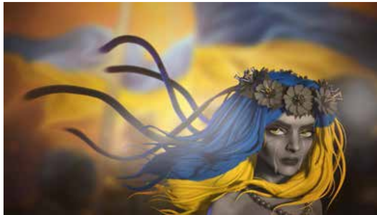
Рис. 1. Ілюстрація із зображенням дівчини-воїна, Тетяна Демакіна

Сьогодні споживачі такої ілюстрації самостійно розповсюджують та популяризують її за допомогою соціальних мереж. Останні стають основною платформою для презентації та публікації таких творів. В результаті для того, щоб ілюстрація побачила світ та зробила свою справу – передала необхідний наратив публіці, в сучасних умовах діджиталізації їй не потрібні класичні друковані видання, час на верстку та підготовку до друку, вона робить це миттєво. Зокрема й через це значення української ілюстрації для висвітлення подій російсько-української війни є вкрай важливим.