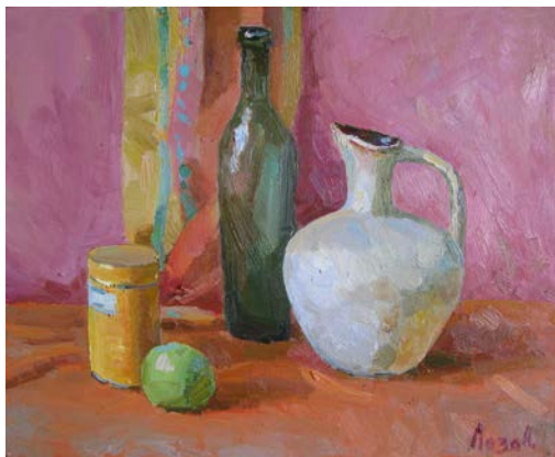
Рис. 11. Готовий навчальний натюрморт у теплій кольоровій гамі

Корисним буде не тільки попрацювати над довготривалими постановками, а й створити низку швидких етюдів на невеличких форматах картону. Швидке сприйняття мотиву постановки та короткотривале втілення у роботі допоможе вихованню у здобувачів загальної зібраності, можливості оперативного аналізу мотиву, відпрацюванню навичок роботи кольором при сприйнятті великих кольорових відносин та застосуванню обмеженої потрібної кількості важливих деталей.