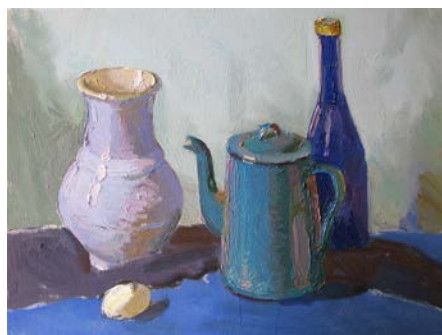
Рис. 9. Етап детальної проробки форми предметів

Не слід забувати й про падаючі тіні від предметів. Вони надають можливість поставити предмет на площині, затвердити його місце у просторі. Слід нагадати: падаюча тінь починається від межі світлотіні на предметі (не від контуру предмета), й найбільш темною буде саме поблизу самого предмета, поступово розсіюючись по мірі віддалення від нього (рис. 9).