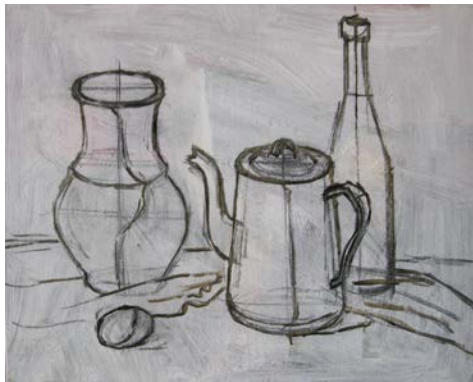
Рис. 4. Конструктивний малюнок на полотні, закріплений олійною фарбою

Таким чином, ми маємо можливість зберегти свій конструктивний малюнок навіть під шаром фарби, й, у разі потреби, його просто відновити. Малюнок, обведений фарбою, повністю просушують! На це може знадобитися від декількох годин до одного чи двох днів.