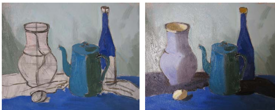
Рис. 5. Перша прописка всіх кольорових плям на полотні. Визначення великих кольорових відносин

Якщо великі відносини здаються нам досить вдалим, переходимо до наступного етапу – детальної проробки форми . Звертаємо увагу на важливий момент. Продовжувати роботу по шару першої прописки можна або одразу, дуже швидко, намагаючись завершити всю роботу протягом не більше як двох-трьох днів, по вологому шару, «вписуючи», «вплавляючи» у нього. Або треба повністю просушити шар першої прописки. Й далі працювати по сухому. На просушування має піти не менше тижня. Технологія олійного живопису не дозволяє працювати по напівпросохлому шару фарби. Це порушення технології може призвести до такого невиправного дефекту, як «прожухання» полотна, коли нижній, не до кінця сухий шар фарби витягує олію з більш пізніх шарів, викликаючи зміни кольору верхніх шарів фарби. Тож, перший шар фарби необхідно повністю просушити, перш ніж переходити до подальшої проробки форми. Якщо ж фарба вже почала підсихати, взялась скоринкою, а очікувати повного висихання немає можливості, слід хоча б