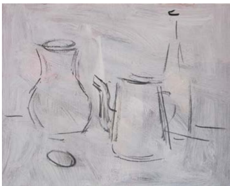
Рис. 2. Композиційний начерк натюрморту на полотні. Компонівка у форматі

Робимо на полотні вільний начерк натюрморту, який фіксує розміри предметів, їх пропорції та розташування відносно один одного, визначаємо великі пропорційні співвідношення між предметами, знаходячи кожному місце на площині, і намічаємо їх загальну форму, не дуже заглиблюючись у точність побудови та деталі (рис. 2).