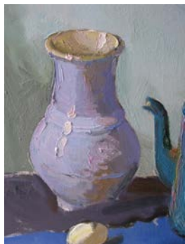
Рис. 8. Етап детальної проробки форми предметів. Крайовий контраст та рефлекси у світлі та в тіні