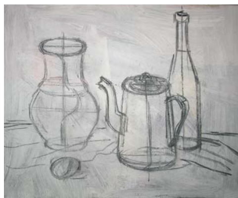
Рис. 3. Побудова предметів натюрморту на полотні

Потрібно, також, провести вертикальні осьові лінії предметів та слідкувати за симетрією і, обов'язково, вимірювати пропорції. Будуємо форму поверхонь предметів проводячи всі їх лінії видимі й невидимі. Предмети, складні за формою, треба подумки розкласти на більш прості за формою частини, подібні до геометричних. У місцях, де одна геометрична форма стикається з іншою, треба проводити горизонтальні вісі, малювати лінії зіткнення форм, й, порівнювати ліву й праву половину предмету, щоб досягти симетрії.