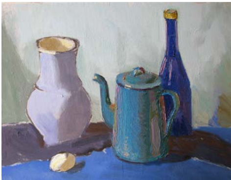
Рис. 6. Етап детальної проробки форми предметів

Незважаючи на те, який спосіб ви обрали, «по вогкому» чи по повністю просушеному шару фарби, переходимо до ліплення об'ємної форми кожного окремого предмету за допомогою градацій світлотіні та рефлексів (рис. 6). Починаючи детальне опрацювання форм, необхідно уважно простежити за всіма відтінками світлотіней на деталях форми та їх переходами з однієї поверхні на іншу. Ліплення об'ємної форми предметів засновується на уважному аналізі впливу світлового середовища. Світлотне та кольорове розмаїття обумовлене існуванням, крім основного, багатьох додаткових джерел освітлення – віддзеркалених випромінювань від інших поверхонь оточуючих предметів. Кожній площині предмету відповідає окрема світлота та кольоровий відтінок, оскільки площини, що створюють форму, знаходяться під різним кутом до джерела освітлення. Кожна площина освітлена по-різному, тому кожен мазок пензлем має виокремлювати площини форми, їх тонові та колірні відмінності. Кількість площин, які ми сприймаємо, залежить від форми предмету та характеру освітлення.