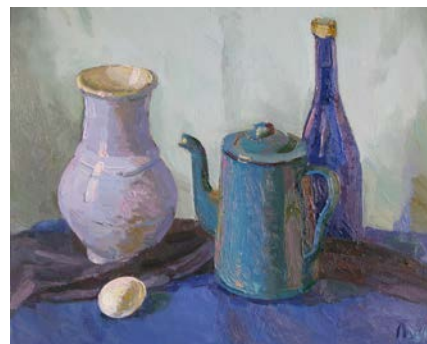
Рис. 10. Готовий навчальний натюрморт у холодній кольоровій гамі

Окремі частини натюрморту повинні бути підпорядковані одна одній та загальному задуму. Найбільші контрасти зосереджують ближче до композиційного центру, прибираючи їх від країв натюрморту. Проводимо процес узагальнення, послідовно порівнюючи частини між собою. Оцінюємо роботу, роздивляючись з відстані, для того, щоб краще побачити ціле. Коли ми виправили всі помилки, враховуючи всі нюанси, про які було сказано вище, наше завдання можна вважати виконаним (рис. 10).