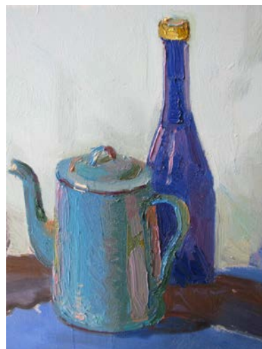
Рис. 7. Етап детальної проробки форми предметів. Крайовий контраст у світлі та в тіні

Ми намагаємося врахувати всі ці особливості й ретельно проліплюємо об'єм кожного окремого предмету, зі всіма градаціями світлотіні. Якщо, спочатку ми розкладали предмет на освітлену та тіньову частину, то зараз маємо у цих великих плямах виокремити напівтіні, рефлексів, відблиск тощо (рис. 8). Проробляємо за формою не тільки предмети, а й драперії, виявляючи форму складок так само за допомогою градацій світлотіні. Обов'язково враховуйте, що складки драпіровки – це складні об'ємні вигнуті форми, на яких можна бачити не тільки тінь та світло, а й багате розмаїття рефлексів та напівтонів.