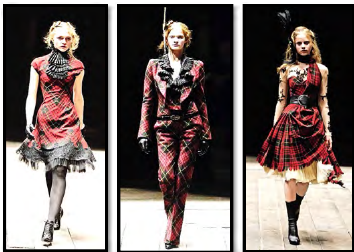
Рис. 6. Колекція “Widows of culloden”, осінь-зима 2006–2007 рр.

– “The Girl Who Lived in the Tree” (2008 р.), назва якої перекладається як «Дівчина, яка жила на дереві» має магічну ауру, яка може натякати на казковий та екзотичний характер цієї колекції. В колекції можна було побачити використання природних елементів та натуральних матеріалів, що надало образам органічність та екологічну врівноваженість. Макквін вдало вплітав в одяг елементи рослинності та структури, надаючи кожному наряду особливий шарм, що показувало його здатність трансформувати природу в моду та створювати образи, що зберігають загадковий дотик (рис. 8);