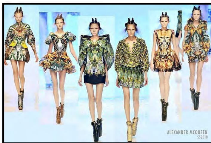
Рис. 10. Колекція “Plato’s atlantis”, весна-літо 2010 р.