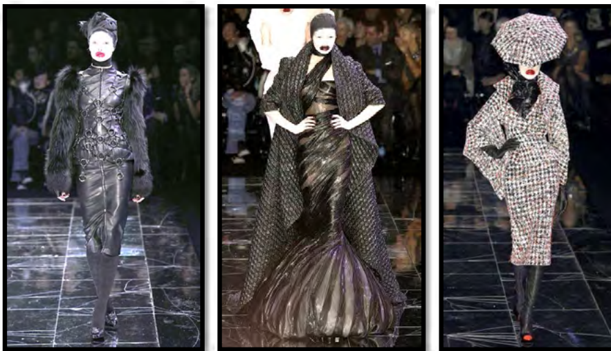
Рис. 9. Колекція “The horn of plenty”, осінь-зима 2009–2010 рр.

Колекція була визнана у модному середовищі як витвір мистецтва, який відображає багатство та різноманіття моди того часу (рис. 9);