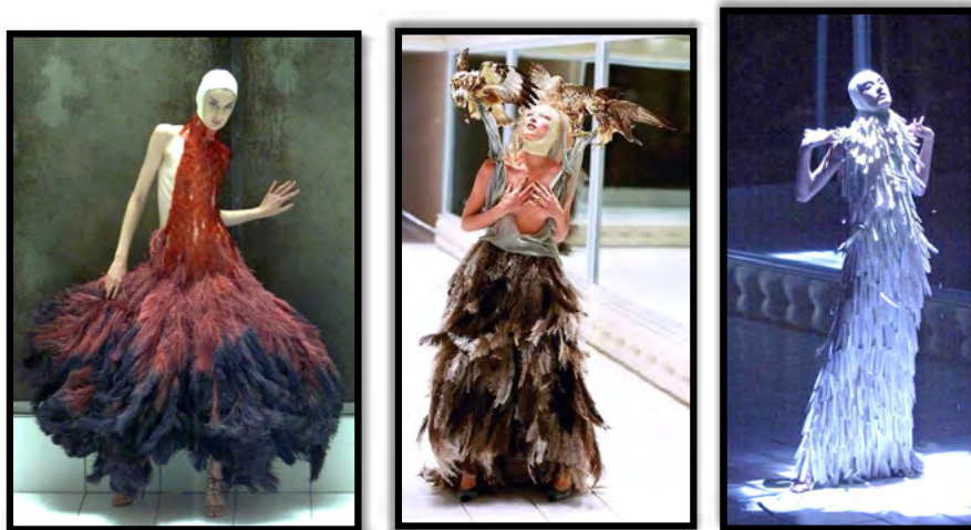
Рис. 3. Колекція “Voss”, весна-літо 2001 р.

та унікальний підхід до моди. Дизайнер використовував незвичайні тканини та матеріали, вражаючі геометричні форми, витончену вишивку та складні деталі, щоб створити враження танцюючого, пере-