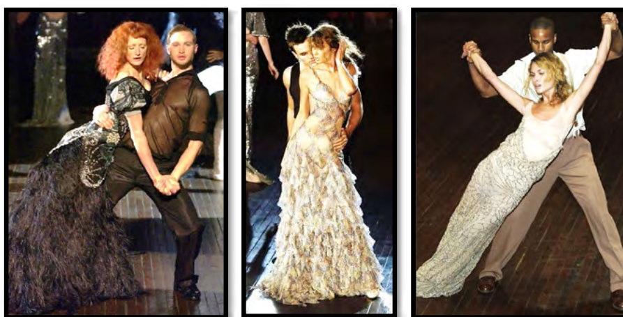
Рис. 5. Колекція “Deliverance”, весна-літо 2004 р.