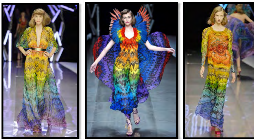
Рис. 7. Колекція “La dame bleue”, весна-літо 2008 р.