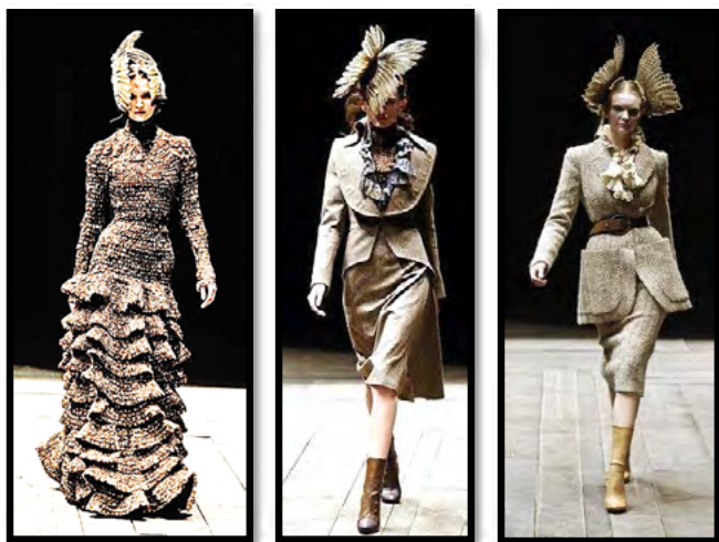
Рис. 2. Колекція “The Birds”, весна-літо 1995 р.