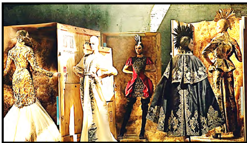
Рис. 11. Колекція “Untitled” (“Angels and demons”), осінь-зима 2010–2011 рр.

використовуючи шаровість та об’ємність, щоб додати глибину кожному образу.