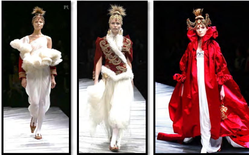
Рис. 8. Колекція “The Girl Who Lived in the Tree”, осінь-зима 2008 р.

– колекція одягу “The horn of plenty” (2009–2010 рр.), концепція якої базувалася на темі розкішного та розмаїтого багатства. Дизайнер використовував різні елементи та мотиви, щоб створити враження великого асортименту та розкішності, експериментував з формами та тканинами, яскравими кольорами та нестандарт-