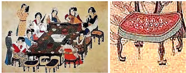
Рис. 2. Чжоу Фанг. «Палацова музика». Фрагменти. Розпис по шовку