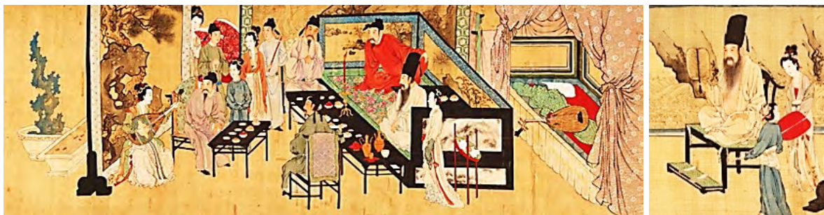
Рис. 3. Гу Хунгчжун. Розпис на шовку. «Нічний бенкет Хань Сідзая»