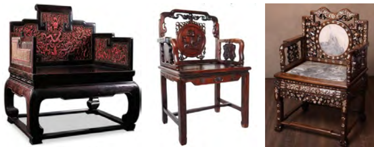
Рис. 12. Меблі для сидіння династії Цин