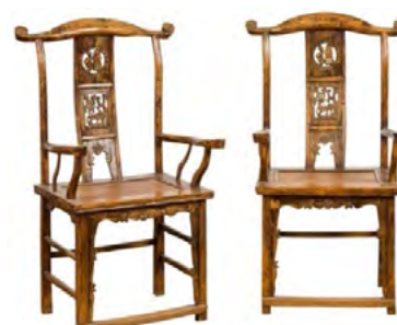
Рис. 10. Крісло-капелюх. Династія Цин