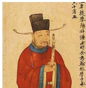
Рис. 8. Портрет Чжао Менфу. Династія Сун