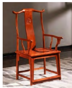
Рис. 9. Крісло-капелюх. Династія Сун