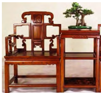
Рис. 7. Крісло «тайші». Династія Сун