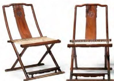
Рис. 4. Розкладний стілець «цзяочжі». Династія Мін

В означений історичний період поширення набуває «крісло-капелюх» (рис. 9), форма спинки якого імітує дизайн офіційного головного убору тогочасних чиновників (рис. 8). Дана форма крісла продовжила існувати у наступні історичні періоди, набуваючи певних трансформацій: пропорції крісла стали ширшими, а декоративне оздоблення більш ажурним та насиченим – спинки крісел