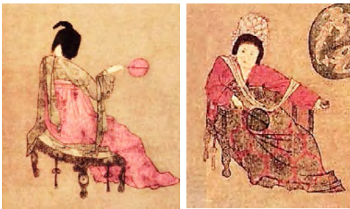
Рис. 1. Чжоу Фанг. «Жінка, що махає віялом». Фрагменти

Означена конструктивна система, яка почала активно застосовуватись у період династії Тан, продовжувала розвиватись у наступні історичні періоди. Наприклад, в меблях періоду П'яти династій (907–960) наявне впровадження стоїчно-балочної системи, що дозволяло створювати міцні об'єкти для сидіння та меблі-підставки на тонких ніжках. При цьому конструкція була надійною та міцною. Приклади таких меблів для сидіння можна побачити у графічних роботах Гу Хунчжуна – художника, який працював у період П'яти Династій. В його серії графічних творів «Нічний портрет Хань Сизая» (рис. 3) показано сцени, де чиновник Хань Сізей влаштував нічний бенкет у себе вдома.