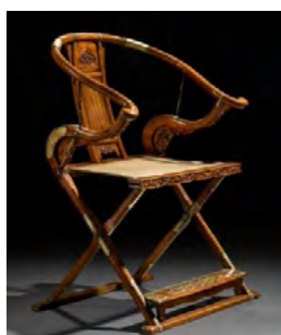
Рис. 5. Стілець «цзяочжі». Династії Мін