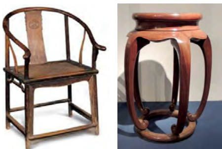
Рис. 11. Меблі династії Мін

В декоративному оздобленні меблів часів династії Цин широко застосовувались зображення фантастичних тварин, квітів (орхідея, хризантема, слива, бамбук), природних явищ, пейзажів, фігур або комбінація кількох візерунків. Кожен елемент мав своє символічне значення та застосовувався не лише для художньої виразності, а й для підкреслення певного соціального статусу володаря. Наприклад, меблі для імператорської родини були оздоблені візерунками у вигляді драконів та феніксів, які символізували визначне місце у соціальній ієрархії (中国古典家具发展史——椅凳宝座篇).