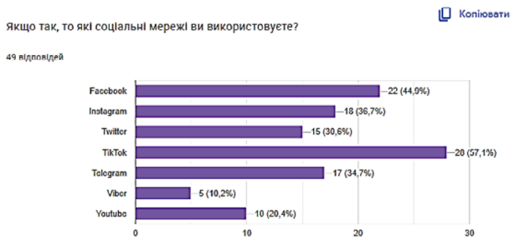
Рис. 3. Результати опитування здобувачів