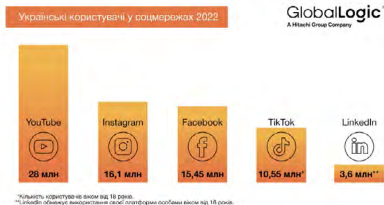
Рис. 1. Кількість користувачів соціальних мереж у 2022 році

• Інструменти соціальних мереж повинні регулюватися закладами освіти відповідно до віку здобувачів.