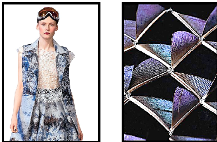
Рис. 3. Тканина 3D з павиного пір'я дизайнера Дж. Мільхейро

хейро відкрила новий текстильний дизайн, поєднуючи пір'я птахів з пряжею та шовком (рис. 3).