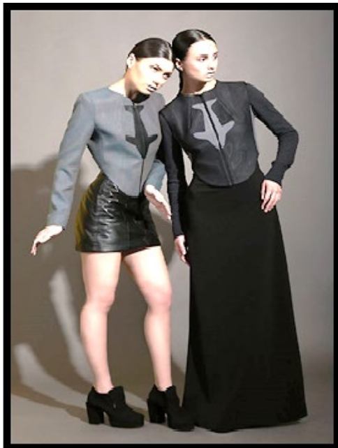
Рис. 1. Одяг колекції REHASH

Отже, названі українські бренди одягу та аксесуарів, що працюють в напрямку реалізації екологічного продукту свідомо привертають увагу до важливого соціального аспекту життя. А формування правильного підходу до моди, першочергово лежить на плечах споживача, проте процес популяризацію еко-напрямку формують бренди. Саме дизайнери своїми колекціями декламують турботливе ставлення до планети та її ресурсів. Частіше за все бренди створюють еко-продукт в якому не використовують натурального хутра, тим самим рятуючи життя тварин, натомість активно популяризують використання перероблених матеріалів або використання текстильного виробу декілька разів, тим самим проявляється турбота про довкілля.