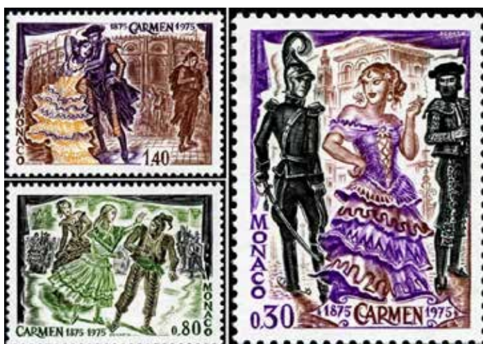
Рис. 2. Поштові марки: серія до 100-річчя від дня прем'єри опери Жоржа Бізе «Кармен» з опери «Кармен», Альбер Декаріс (Королівство Монако, 1975)