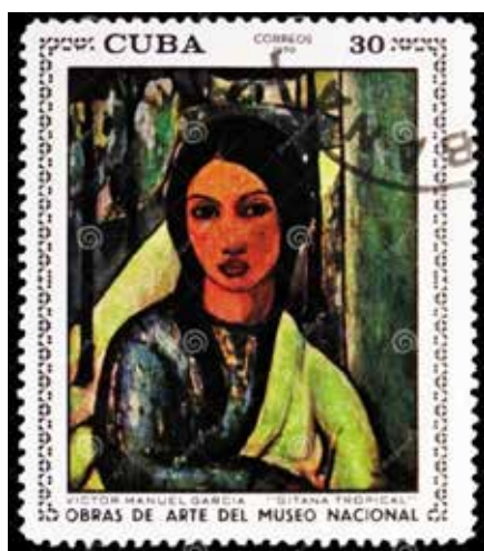
Рис. 1. Поштова марка: «Тропічна циганка», Віктор Мануель Гарсія (Республіка Куба, 1970)

До 100-річчя від дня прем'єри відомої опери Жоржа Бізе «Кармен» у 1975 р. в Князівстві Монако було випущено серію поштових марок, присвячених цій визначній даті (рис. 2). Ескізи марок до опери «Кармен» створив Альбер Декаріс ( фр. Albert Decaris ) – відомий французький художник-графік, який працював переважно в техніці офорта (De Opera, n.d.). Його роботи відзначаються реалістичністю зображень, увагою до деталей, вмінням створити об'ємність на стриманій площині. Стиль художника досить еkleктичний та поєднує риси академічної школи з модерністськими прийомами. У роботах на тему «Кармен» відчувається вплив іспанського коло-