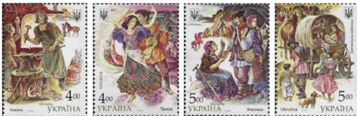
Рис. 8. Поштові марки: серія «Національні меншини в Україні. Роми» – (Коваль», «Танок», «Ворожка», «Циганська кибитка»), Микола Кочубей (Україна, 2017)

У 2017 р. в Україні було випущено серію з 4 поштових марок під назвою «Національні меншини в Україні. Роми» (рис. 8). Ескізи створив відомий графік і дизайнер Микола Кочубей, котрий зобразив ромів у традиційних заняттях та побуті, але в дещо декоративній інтерпретації з використанням яскравої кольорової гами. Таким чином, ці графічні твори репрезентують сприйняття ром-