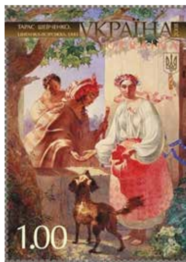
Рис. 6. Поштова марка: «Циганка-ворожка», Тарас Шевченко (Україна, 2008)