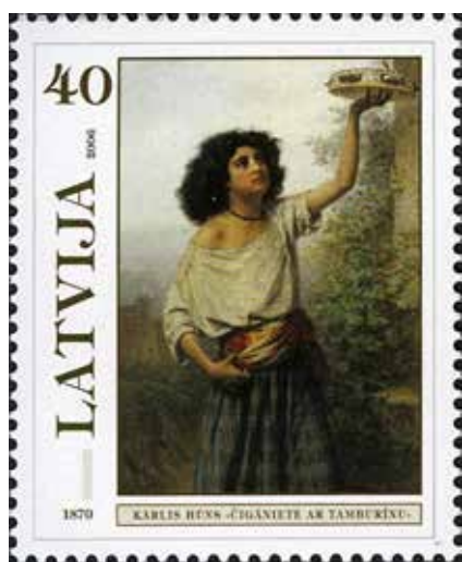
Рис. 5. Поштова марка: «Циганка з тамбурином», Карліс Гун (Латвія, 2006)

Картина «Портрет циганки» румунського художника Ніколае Григореску (рум. Nicolae Grigorescu ), відтворена на поштовій марці номіналом 4,30 лея, є маловідомим твором митця. На ній зображено молоду і вродливу дівчину-ромку в традиційному вбранні румунського народу. Вона представлена в анфас, відтінена нейтральним тлом природи. Особливу увагу художник приділив передачі рис обличчя дівчини – смугла