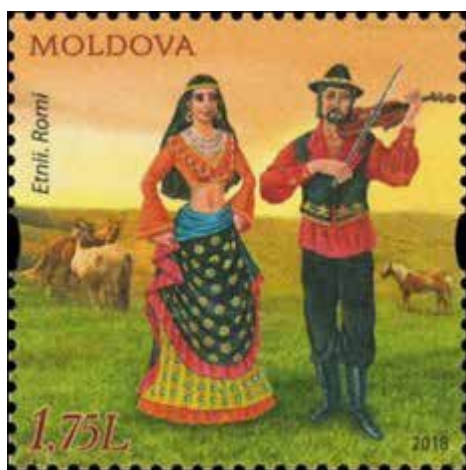
Рис. 9. Поштова марка: «Етноси Молдови. Цигани», Олег Кожокар (Молдова, 2018)

У 2018 р. в Молдові державною компанією «Poșta Moldovei» представила поштову марку з серії «Етноси Молдови. Цигани» (рис. 9) номіналом 1,75 лея, на якій Олег Кожокар зобразив молоду ромську пару на лоні природи, поруч із кінями на випасі. Чоловік грає на скрипці, а молода жінка зображена в момент танцю під акомпанемент скрипки – її руки тримаються за призібрану спідницю, яка розвівається від танцювальних рухів. Пара сповнена радості життя та ромського колориту, про який свідчать їхні заняття, вбрання, пейзажне тло і коні як невід'ємні супутники всієї