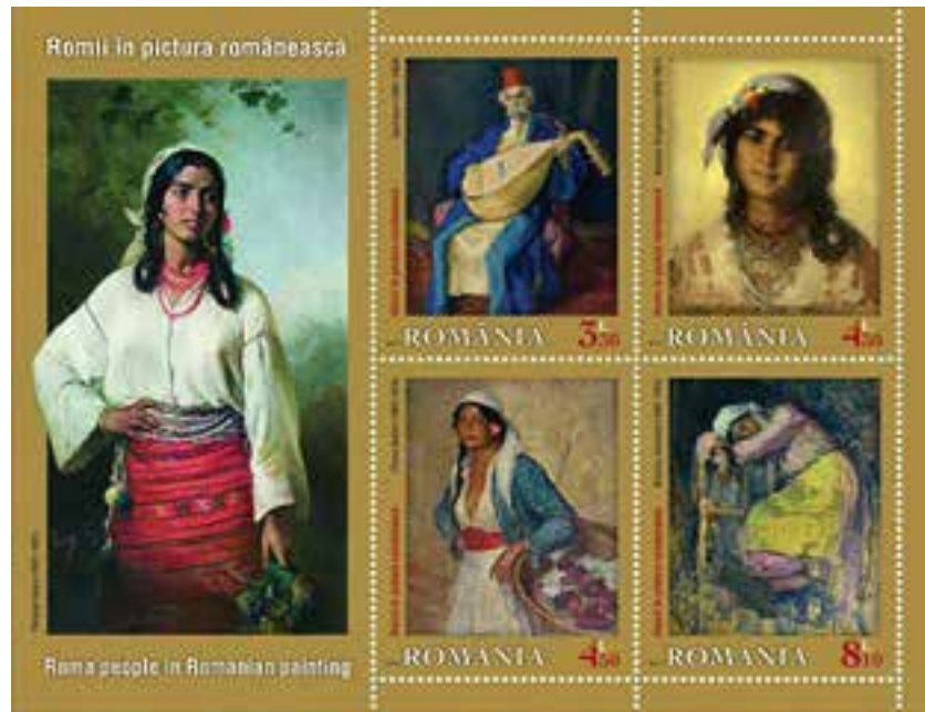
Рис. 7. Поштові марки: серія «Роми в румунському живописі», Йосип Ізер, Ніколае Григореску, П'єр Белле, Ніколае Вермонт (Румунія, 2014)

шкіра й чорне волосся, великі темні очі, густі брови, яскраві губи. Її образ сповнений ромської життєвої енергії та оптимізму. Живопису Ніколае Григореску притаманна реалістична манера з використанням прийомів плернерного освітлення. Саме таким є і яскравий, сповнений внутрішнього світла портрет молодої ромки.