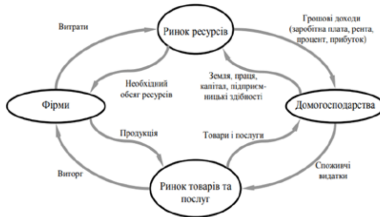
Рис. 1. Ядро терміноапарату мікроекономіки

формують ядро терміноапарату макроекономіки . Разом мікро- та макроекономіки утворюють терміносистему економічної теорії, яку можна зобразити графічно (див. рис. 2) (Ставицький, Харламова 2018).