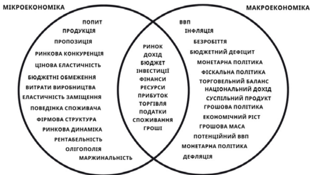
Рис. 3. Розподіл термінів за мікро- та макросферами

Критерій стратифікації « об'єкт дослідження » допомагає зрозуміти, що саме вивчають економічні терміни та як вони відображають економічні явища. Наприклад, в мікроекономіці, термін «попит» характеризує окремі агенти, такі як