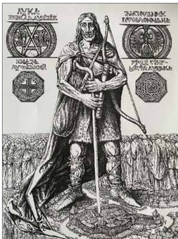
Рис. 4. Дишко О. Вождь Лука. 2016