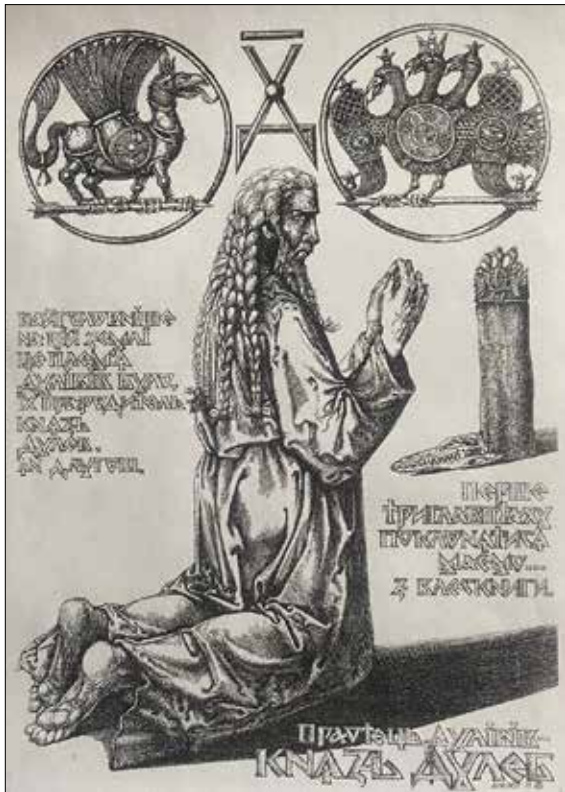
Рис. 1. Дишко О. Князь Дулеб. 2015