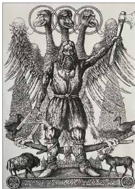
Рис. 5. Дишко О. Вождь Велинь. 2016

порівняно дрібною сінького Луцького замку, що знаходиться у нього прямо перед ногами. Композиція статична. Проблему руху й антируху митець вирішує застосувавши оригінальний композиційний прийом, де одна форма рухається назустріч іншій. Цей прийом прослідковуємо у зображенні руху фігур заднього плану картини. Рівновага композиції досягнута симетричним зображенням піктограм, які підкорені як композиційному, так і геометричному центру твору. Для реалізації своїх ідей О. Дишко використовує графічні засоби вираження форми: пляму, штрих, крапку, лінію.