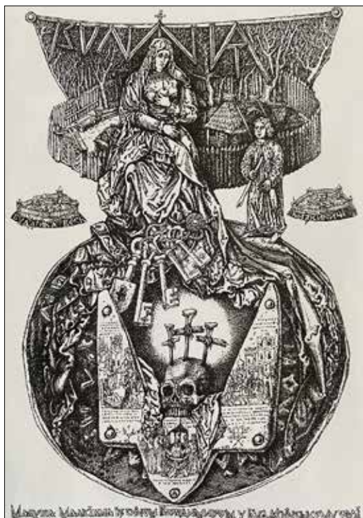
Рис. 12. Дишко О. Малуша. 2016

картографічного зображення укріпленого поселення Будатин та села Низкиничі (згідно нових досліджень – вотчини її батька), з величезною низкою ключів в ногах. Всі ці творчі надбання художник виконав у техніках вільної графіки.