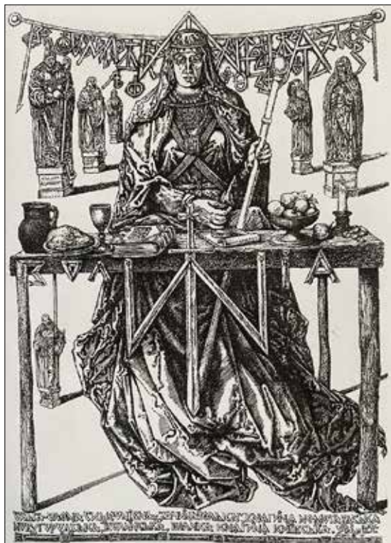
Рис. 11. Дишко О. Княгиня Ольга. 2016

«Княгиня Ольга» (рис. 11) зображена, сидячи за столом, з жезлом в руках (символом влади), книгою і мечем поряд, з медальйоном-колокрутом на грудях. «Матір князя Володимира Великого – Малуша» (рис. 12) зображена з сином – на фоні