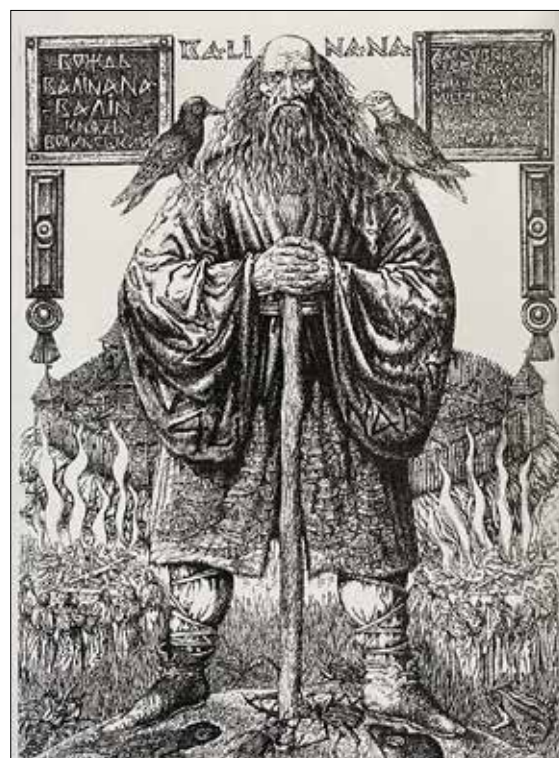
Рис. 6. Дишко О. Вождь Валінана. 2016

«Вождь Черевань» (рис. 7), будівельний і засновник міста Червена, столиці Червенських градів, оточений з двох боків левом і биком, на плечі яких він спирається, тримає в руках герб із зображенням жінки-птахи (Матірслави). «Маж – перший король Червенії» (рис. 8), збирач Побужських та Волинських племен, представлений у вигляді погруддя, до якого прилягають племена