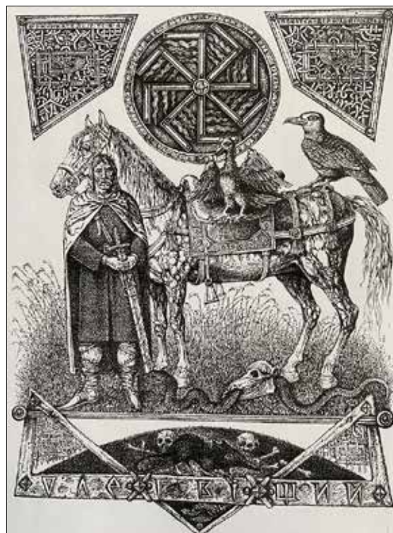
Рис. 10. Дишко О. Князь Олег. 2016