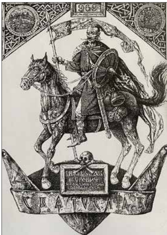
Рис. 9. Дишко О. Святослав. 2016

біля живого коня, на сидлі якого – два орла, із змієм біля ніг, що виповзає з конячого черепа, зі знаком восьмираменної лівобічної свастики у верхній частині картини (колокрутом князів руських).