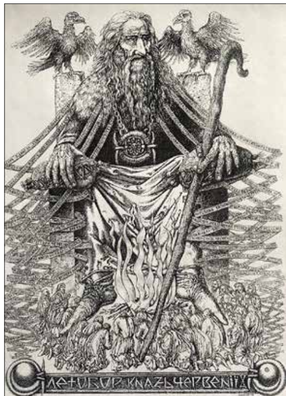
Рис. 3. Дишко О. Князь Летобор. 2016

пера. «Вождь Лука», засновник міста Луцька (рис. 4), зображений величним з луком на плечі і ціпом, устромленим в картографічне зображення