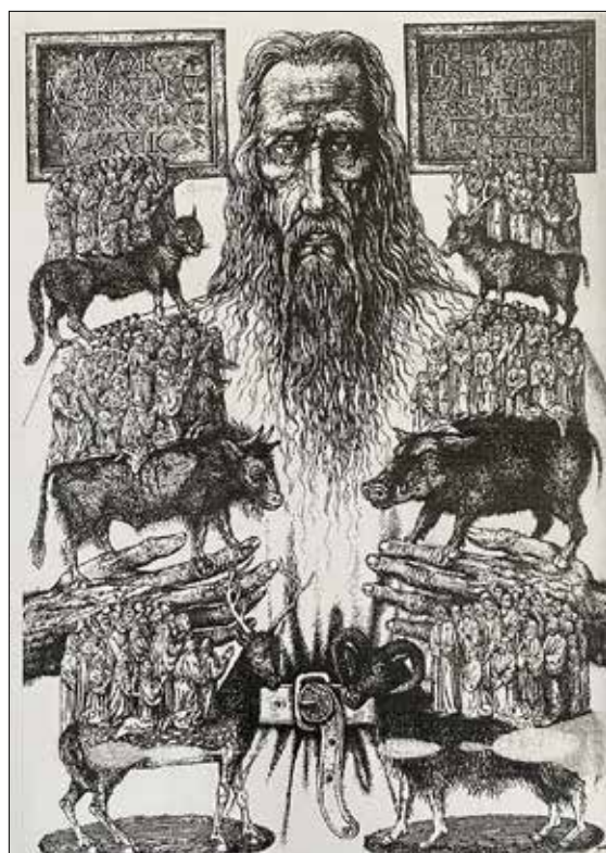
Рис. 8. Дишко О. Король Маж. 2016.

Постать «Святослава – володаря Русі» (рис. 9) зображена верхи на коні з прапором в руках. «Князь Олег», за переказом отруений змієм, що виліз із черепа його мертвого коня (рис. 10) – спішений,