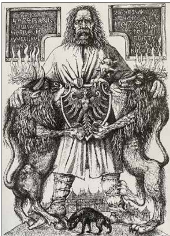
Рис. 7. Дишко О. Вождь Черевань. 2016