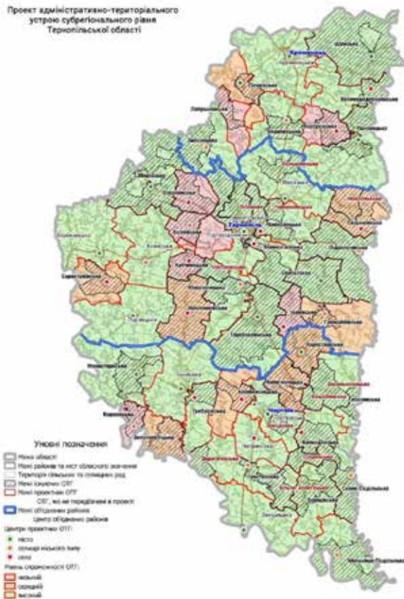
Рис. 1. Нові райони Тернопільщини

райони) відомо про наявність до 2000 р. близько 75 інструментів на парафіях.