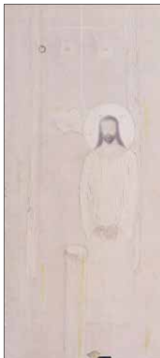
Рис. 2. Всі ви мої діти. 1998. П., о.

Символіка в живописних роботах абстракціоніста є втіленням авторської міфології та його