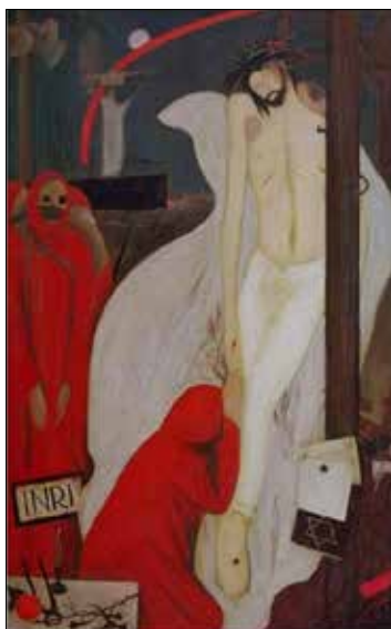
Рис. 1. Ходження по колу. 1993. П., о.

та стигмати. В даній композиції фігурі мертвого Ісуса притаманна неприродна легкість, як і в однофігурній композиції 1998 року «Всі ви мої діти» (рис. 2). Фігура Христа пов'язана з символічними об'єктами: кайданів (символ страстей Христових), чашею (символ причастя та крові Христової), чорним квадратом (символ пекла) та листям дерева поряд з ним, який на межі між Христом та пеклом. Символ листя часто фігурує у віршах О. Коденка і є алегорією на людську душу. Так у полотні «Всі ви мої діти» листя є метафорою буття людини, що межує між пеклом і горнім світом.