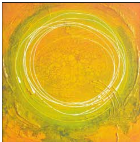
Рис. 3. Квітка життя. 2018. П., о.

Символізм творів О. Коденка є невід'ємною частиною художньої виразності його творів та джерелом авторського підтексту. Трансцендентальна медитація була основою творчого процесу під час пошуку новітніх форм. Поєднання семіотики різних культур, особисті філософські пошуки склались в авторське бачення поняття сакрального в творах мистця. Синтез символів та знаків в полотнах збагатив абстрактний живопис О. Коденка, відкриваючи новий погляд на тему духовного в сучасному його прояві.