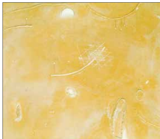
Рис. 4. Мантра. 2000. П., о.