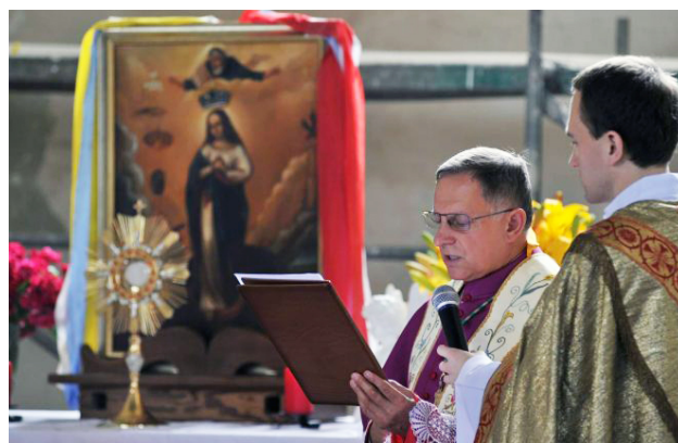
Рис. 9. Митрополит Львівський Архієпископ Мечислав Мокшицький оголосив храм Святого Архангела Михаїла Санктуарієм Матері Божої Зцілення Хворих (Див.: В Україні з'явився санктуарій Богородиці Зцілення Хворих. Фото: Сергій Якубовський)

На завершення зачитано Акт відання Божій Матері Зцілення Хворих усіх хворих та страждених просячи заступництва у Пресвятої Діви Марії (В Україні з'явився санктуарій Богородиці Зцілення Хворих, 2020) (Рис. 9).