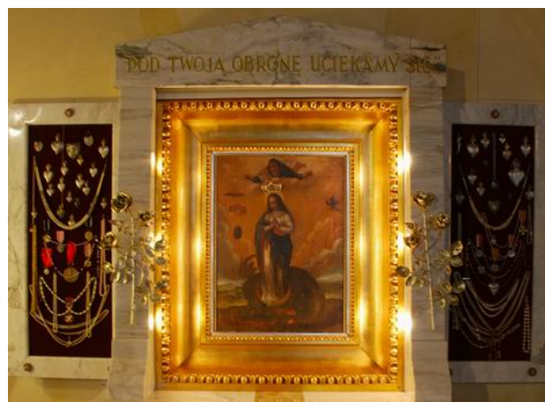
Рис. 2. Вота біля чудотворного образу Матері Божої