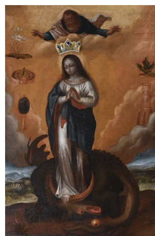
Рис. 1. Чудотворний образ Пресвятої Діви Марії Непорочно Зачатої – Матері Божої з Таракова

Над Непорочною Дівою видніється образ Бога Отця, а під її ногами – мертвий крилатий дракон, з яблуком, що викотилося з його пащі. Обабіч постаті Діви Марії, на золотистому тлі, зображені біблійні символи: праворуч – Небесні Врата, Неопалима Купина та Вежа Давидова, а ліворуч – Лілії серед терня, Дерево Життя та Дзеркало Правосуддя над природним ландшафтом (Kukiz, 2000: 169; Historia i opis Cudownego obrazu Matki Bożej Łukawieckiej) (рис. 1–2).