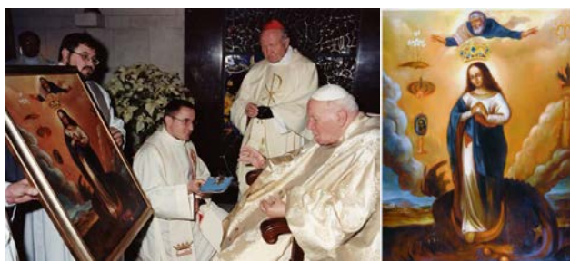
Рис. 7–8. Коронація копії чудотворного образу Пресвятої Діви Марії Непорочно Зачатої (Матері Божої Тартаківської); Коронована копія чудотворного образу Пресвятої Діви Марії Непорочно Зачатої з Тараківа (Див.: Historia i opis cudownego obrazu Matki Bożej Łukawieckiej)

бисто зайнявся підготовкою та перебігом церемонії освячення та коронації копії чудотворного образу. 8 січня 2004 р. у приватній каплиці після Святої Меси Папа Римський Йоганн Павло II коронував копію чудотворного образу Пресвятої Діви Марії Непорочно Зачатої (Матері Божої Тартаківської). Урочисту Святу Месу зі Святішим Отцем співслужили: Кардинал Маріан Яворський, Архієпископ Станіслав Дзівіш, отець-прелат Мечислав Мокшицький, отець-прелат Станіслав Корнага, о. Олег Саламон та священники Львівської дієцезії, які навчалися в Римі: о. Анджей Легович, о. Пьотр Малий, о. Леон Саламон, о. Ян Ших, о. Міхал Чоровський. Після освячення та коронації копія чудотворного образу повернулася у Львівську Архідієцезію на вівтар Тартаківського костелу (Pulnar, 2012: 34–35) (рис. 7–8).