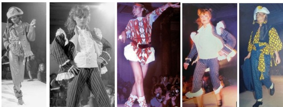
Рис. 3. Vivienne Westwood «Pirates», 1981 ( https://www.pinterest.com/pin/vivienne-westwood-pirates-aw-1981--680043612485368823/ )