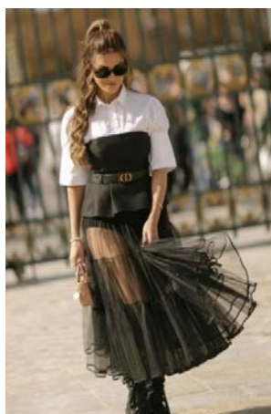
Christian Dior Street Style ( https://www.pinterest.com/pin/christian-dior-street-style-outfit-ideas--299770918960698187/ )

Сьогодні Street Style тісно переплітається з безліччю брендів вуличного одягу, які стали куль-