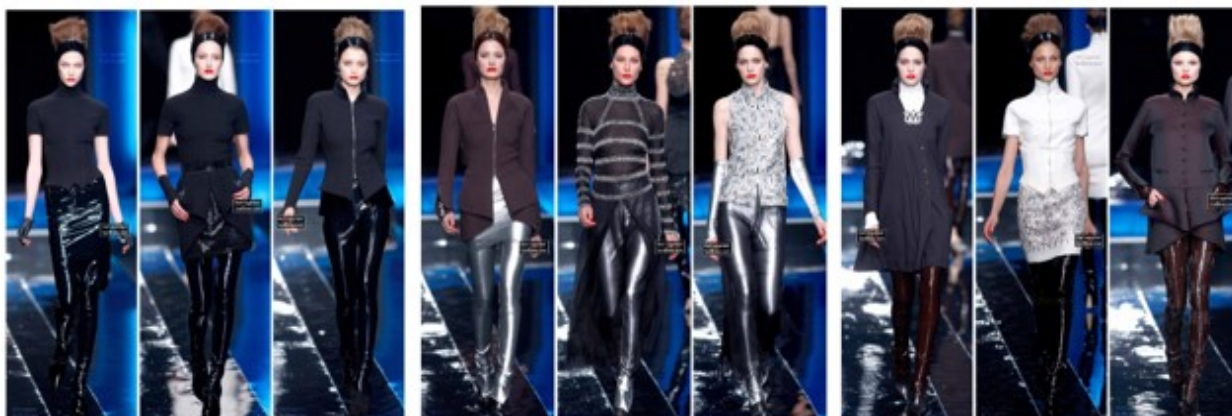
Рис. 2. Karl Lagerfeld Street Styles ( https://bcr8tive.com/karl-lagerfeld-street-styles/ )

Вів'єн Вествуд продовжувала і надалі використовувати елементи вуличного стилю у своїх колек-