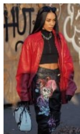
Prada Street Style