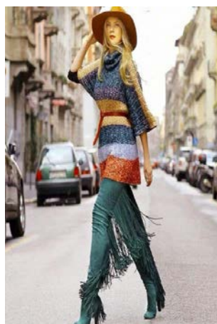
Roberto Cavalli Street Style ( https://www.pinterest.com/pin/447263806719108189/ )