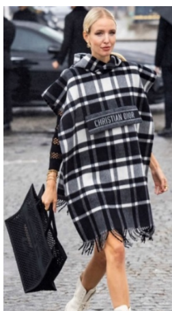
Christian Dior Street Style ( https://insider.ua/street-style-najstilnishi-gosti-pokazu-dior/ )