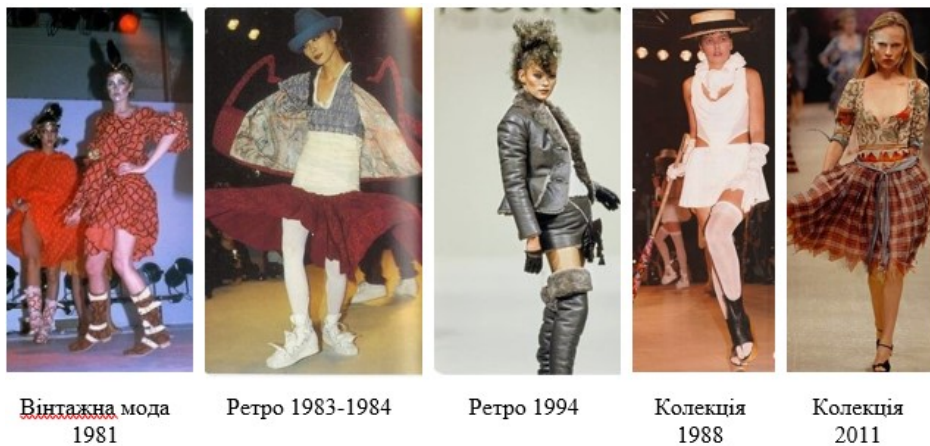
Рис. 4. Із колекцій Вів’єн Вествуд ( https://www.pinterest.com/pin/vivienne-westwood-pirates-aw-1981--680043612485368823/ )

Поступово рафіновані ідеали краси, втілені в образах Високої моди, та ідеали, що зародилися в молодіжному середовищі, злилися в єдине ціле, трансформували загальноприйняті зразки краси. Дизайнери, беручи за основу зовнішні типізовані риси образів прихильників субкультур, створюю-