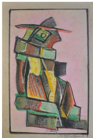
Іл. 7. Без назви, 2000, змішана авторська техніка, 20,5x27. Приватна збірка С. Дзіндри

Так, динамічний композиційний принцип покладено в основу роботи 2001 року (Іл. 6) з фігурою, утвореною нашаруванням орнаментальних фрагментів, схожих на народні килими чи ліжники. Асоціації із танцем викликають експресивний абрис та консолідована центральною віссю різновекторність динамічних площин. Тональній і ритмічній диференціації слугують барвисті дрібні елементи на чорному тлі. Формотворенню архаїчних культур суголосять монументальність і чорно-коричнево-вохристій колорит.