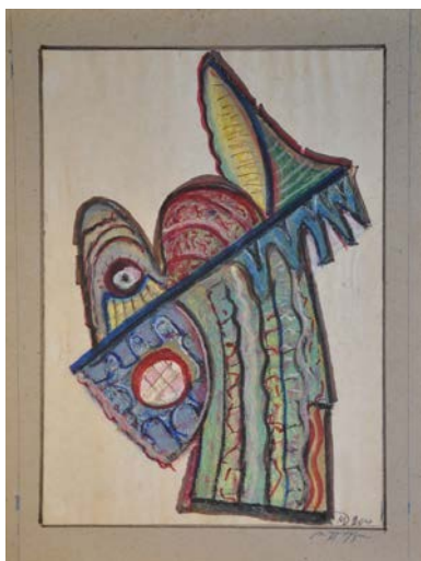
Іл. 12. Без назви, 2001, змішана авторська техніка, 42x30,5. Приватна збірка С. Дзиндри

урівноваженості зображенню надають розташування фігури на центральній осі аркуша, замкнутість вигнутих ліній, що утворюють вісімку, урівноваженість лівої і правої зелених площин. Експресивні ноти у композицію вносить «пульсування» впевненого гнучкого контуру з переходами від чорного до синього, червоного та карміну. Ефект мерехтливої поверхні, властивої й скульптурним творам майстра, створюють сітчасті перетини ліній, нанесених пензлем у тон тлу.