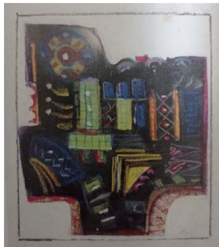
Іл. 18. Без назви, 2000, олійна пастель, 28x33. Приватна збірка

Чільне місце у графічному доробку М. Дзиндри посідають різноманітні за образно-тематичним наповненням зображення людських груп . Прикладом є «Три королі» (2001) (Рис. 17) з узагальненими ритмізованими чорно-зеленавими прямокутниками, що нагадують абрисы людських фігур. Засобом виразності в композиції слугує епічна монументальність, у розумінні М. Дзиндри – синонім закінченості мистецького вислову, формотворчий принцип, неодноразово актуалізований у скульптурних роботах митця («Колядники», 1973; «Родина мертвим», 1982 та ін.). Формуванню казкового хронотопу, образу старовинного королівства, що зустрічається й в скульптурних композиціях майстра («Король», б/р; «Королева», 1967; «Король і королева», 1974; барельєф «Король», 1976), сприяють зіставлення глибоких, насичених, звучних барв.