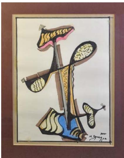
Іл. 9. Без назви, 2000, змішана авторська техніка, 28x20,5. Приватна збірка С. Дзиндри

Екзистенційну кризу та руйнацію відтворено в атектонічній комбінації прямокутників у композиції 2001 року (Іл. 8). Відчуття меланхолії, самотності, безвиході, відчаю посилюють експресивний «рваний» контур, грубі білі мазки на темному тлі, поєднання глибоких синіх і чорних тонів.