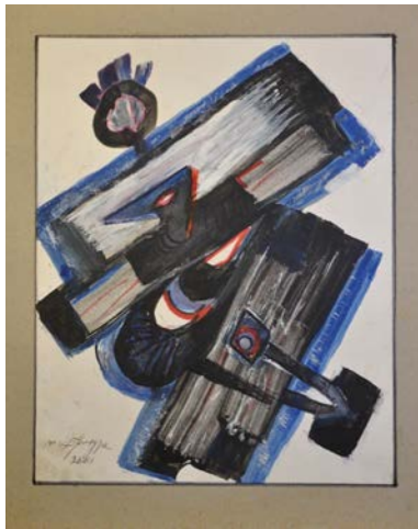
Іл. 8. Без назви, 2001, змішана авторська техніка, 35,5x28. Приватна збірка С. Дзиндри

Екзистенційну кризу та руйнацію відтворено в атектонічній комбінації прямокутників у композиції 2001 року (Іл. 8). Відчуття меланхолії, самотності, безвиході, відчаю посилюють експресивний «рваний» контур, грубі білі мазки на темному тлі, поєднання глибоких синіх і чорних тонів.