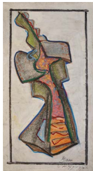
Іл. 13. Без назви, 2000, змішана авторська техніка, 26x12. Приватна збірка С. Дзиндри

Іскристою енергією, іронією та ніжністю сповнені зображення жіночих постатей, численні у доробку митця. Зокрема життєствердне начало утілено в танцюючих жіночих фігурах, окресле-