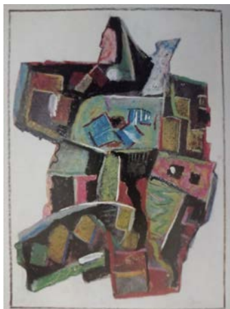
Іл. 6. Без назви, 2001, олійна пастель, 44x31. Приватна збірка

Чільне місце у графічному доробку М. Дзіндри посідають асоціативні зображення поодиноких людських постатей , утворених з геометричних елементів або ж «відчитуваних» у нашаруваннях площин.