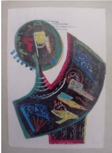
Іл. 3. Без назви, без датування, олійна пастель, 44x31. Приватна збірка

(Іл. 2) зі схожою на кабачок подовженою головою, хвилястими пасмами волосся, носом-паличкою, вустами-галочкою та кумедними вирячкуватими очима на рожево-блакитному тлі. Доброзичливий гумор уподібнює зображення шаржу та рельєфним «гротескним маскам» М. Дзиндри 1973–1999 років. Як і в інших графічних роботах скульптора, творенню образу слугує контур, що окреслює площини, заповнені м'яким пастельним штрихом.