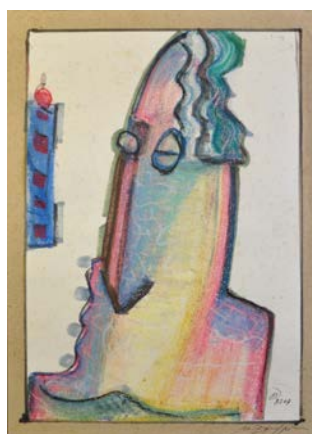
Іл. 2. Без назви, 2001, олійна пастель, 30x21. Приватна збірка С. Дзиндри

Чільне місце з-поміж дзиндрівських графічних образно-асоціативних композицій, в яких узагальнені візуальні форми відсилають до об'єктів, явищ, процесів оточуючої дійсності та корелюють зі спектром почуттів, посідають портрети – від сповнених відлунь предметності, гротескних і ліричних, до заснованих на відчитанні образу з зіставлень силуетів, ліній, площин. Так, збереження зв'язку із дійсністю при узагальненості зображення характерне для виконаного у змішаній техніці (гуаш, масляна пастель, кулькова ручка) портрета 2000 року (Іл. 1) із сумним чоловічим ликом. Засобом художньої виразності слугує, імовірно, інспірована П. Пікассо деструкція видимого, підпорядкована відтворенню емоційного стану та істотних рис. Водночас, на відміну від визначного іспано-французького митця, М. Дзиндра зберігає скульптурну цілісність форми, виразно репрезентованої на світло-сірому тлі.