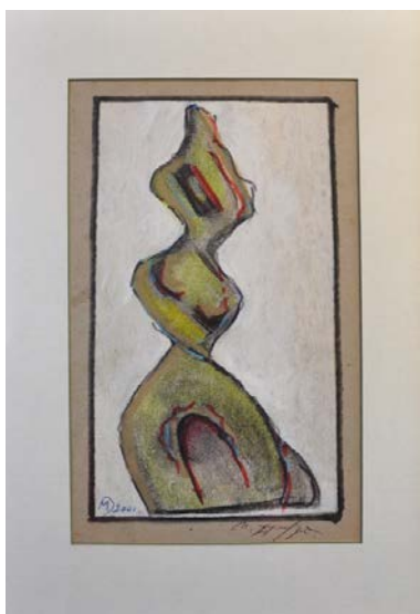
Лл. 15. Без назви, 2001, змішана авторська техніка, 21x12. Приватна збірка

чорного, оливкового, жовтого кольорів. Показове вловлювання М. Дзиндрою «домінантної ноти» руху при імперсональності обличчя та форм.