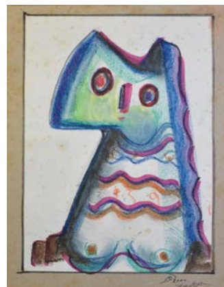
Іл. 5. Без назви, 2000, олійна пастель, 30x22. Приватна збірка С. Дзиндри

«Галерея» графічних портретів М. Дзиндри містить низку жіночих образів – іронічних або ж вишукано естетизованих. До останніх відносимо виконане у змішаній техніці (пастель, фломастер, олівець) жіноче зображення (Іл. 4) із легким граційним нахилом голови, пелюстком-капелюхом, мигдалевидним оком і тонкою шиєю, схожою на рослинне стебло. Рафіновану жіночність відтворює диференційований діагональний ритм геометризованих форм. Життєву силу і таємницю, асоційовані з жіночим началом, віддзеркалено в поєднанні смарагдових і вохристих барв. Ліричній інтерпретації образу слугують плавність ліній та заповнення площин «повітряними», легкими штрихами пастелі, з-під яких просвічує тло.