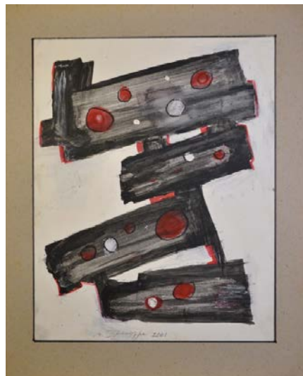
Лл. 16. Без назви, 2001, змішана авторська техніка, 35,5x28. Приватна збірка С. Дзиндри

Перегуки з пластикою Трипілля простежуються в аркуші 2001 року (Лл. 15) із монументальною жіночою постаттю, наче сповитою німотою віків. Так, із трипільською скульптурою зображення споріднюють імперсональність, узагальненість, увиразнення форм орнаментальними смугами, акцентування пов'язаних із плідністю статевих ознак. Засобами художньої виразності слугують вісімкоподібний вертикальний ритм зменшуваних об'ємів, кармін орнаментики, чорний контур, вохристо-зеленаві барви, асоційовані з давниною століть.