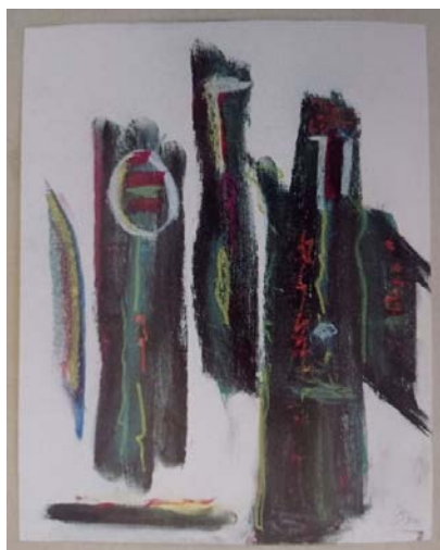
Іл. 17. «Три королі», 2001, олійна пастель, 38x29. Приватна збірка