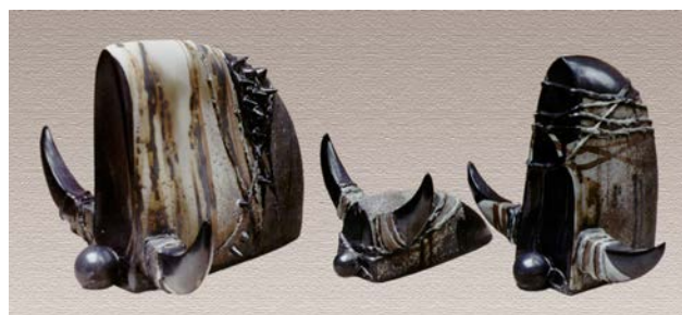
Іл. 3. Хижинський В. «Чумацький шлях», 1996 р., порцеляна, солі, поливи, люстри, відливка в гіпсову форму, ручне ліплення, h 35 см