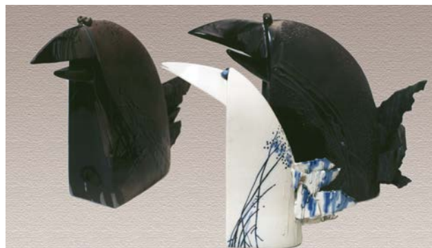
Іл. 4. Хижинський В. «Конфлікт поколінь», 1996 р., порцеляна, солі, поливи, люстри, відливка в гіпсову форму, ручне ліплення, h 35 см