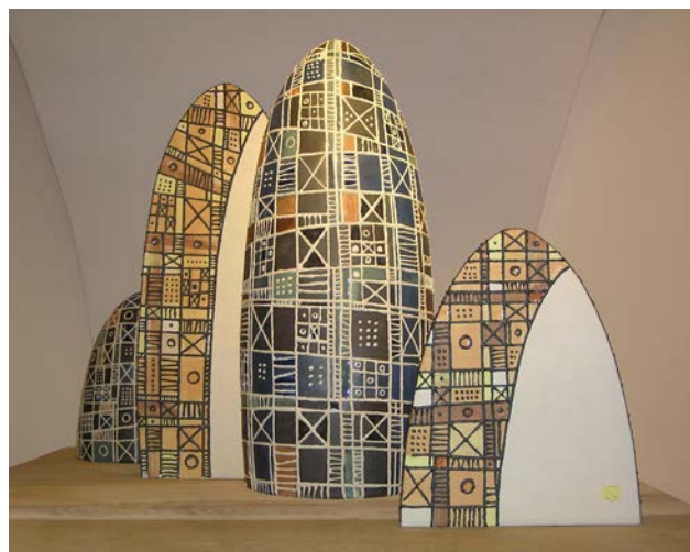
Іл. 10. Хижинський В. «Між днем і ніччю», 2003 р., кам'яна маса, пігменти, поливи, відливка в гіпсову форму, ручне ліплення, розпис, h 55 см

У 2003 році В. Хижинський отримує творчу стипендію від галереї “Kunstforum Piaristen” (м. Відень, Австрія). Стипендією передбачалася творча робота протягом місяця в керамічній майстерні, що знаходилася при галереї, в історичному центрі Відня. За час перебування у Відні митець створив п'ять робіт з антропоморфної пластики, але вже максимально узагальненої та абстракт-