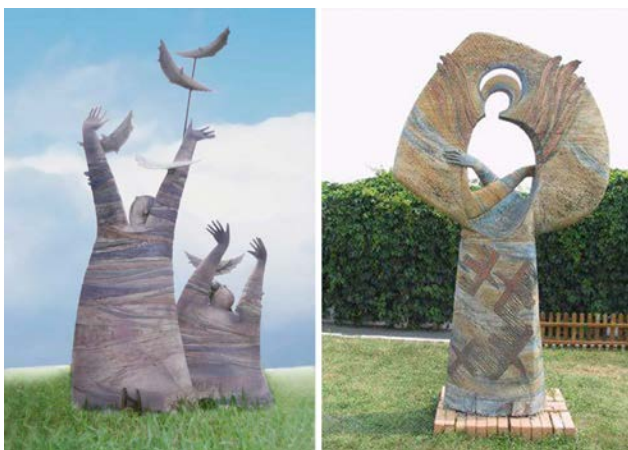
Іл. 7. Хижинський В. «Сполохані мрії», 1999 р., h 220 см. «Окрилена», 2000 р., h 320 см. Кольорові шамотні маси, поливи, окисли металів, ручне ліплення

їми контурами нагадує дерево, на стовбурі якого зображені символічні птахи. Центральний образ роботи – іконописне зображення у вітах дерева Божої Матері. Робота виконана із дотриманням усіх церковних канонів. Руки – навхрест, права рука зверху, долоні повернуті до тіла й голова схилена в покорі. Але тут є цікавий момент: одна долоня виходить на один бік, а інша – на другий, вона ніби обіймає. Ось таке положення рук говорить нам про те, що де б ми не знаходились відносно цієї роботи, ми завжди будемо під охороною Божої Матері» (Музей гончарства, 2021).