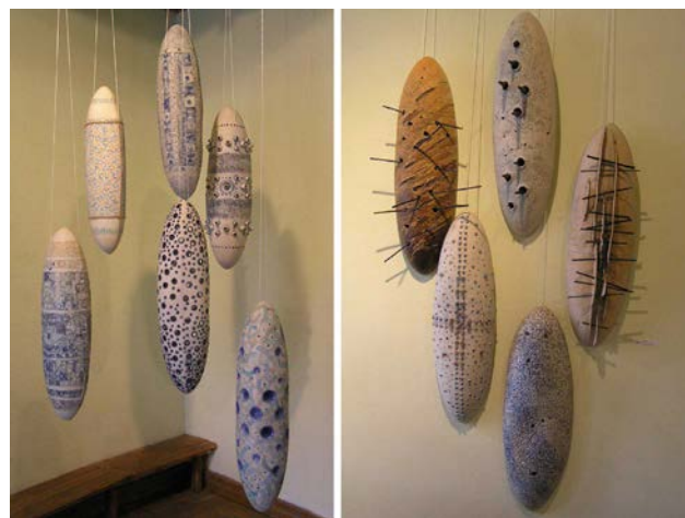
Іл. 8. Хижинський В. «Об'єкти», 2002 р. «Агресія», 2003 р., кам'яна маса, пігменти, поливи, метал, відливка в гіпсову форму, ручне ліплення, розпис, h 80 см (кожен елемент)

У 2002 та 2003 роках В. Хижинський узяв участь у керамічно-скульптурних пленерах у м. Болеславець (Польща), яке є відомим центром польської кераміки, а керамічно-скульптурні пленери, які там відбуваються, чи не найстаріші в Польщі. Власне, 2002 рік ознаменувався знайомством митця зі світовою сучасною керамікою і творчістю відомих закордонних керамістів (Хижинський, 2024: 2). На болеславецьких пленерах було виконано абстрактні керамічні композиції «Об'єкти» (2002), «Агресія» (2003) (іл. 8), «Неминучість» (2003) (іл. 9), «Між днем і ніччю» (2003) (іл. 10), основою яких стала проста форма у вигляді кокона, яку шляхом розрізання та додавання різних ліпних елементів або розпису було видозмінено. Відбувається переосмислення творчого світогляду, художник шукає свою авторську мову та багато експериментує з різними технологіями декорування кераміки, намагається поєднувати кераміку з іншими матеріалами, зокрема з металом. Зазначимо, що в цей час митець практично відмовляється (за незначними винятками) від відтворення фігури людини як у формах, так і в розписах.