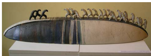
Іл. 9. Хижинський В. «Неминучість», 2003 р., кам'яна маса, пігменти, поливи, відливка в гіпсову форму, ручне ліплення, розпис. 30x80x28 см