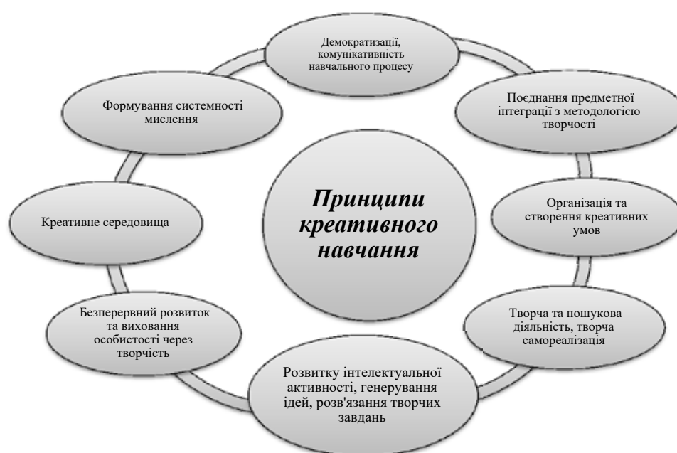
Рис. 1. Принципи креативного навчання з урахуванням компетентнісного підходу

Компетентнісний підхід спрямований на посилення практичної орієнтації вищої освіти, і за своєю концептуальною ідеєю покликаний зробити загальносистемний аналіз освіти у бік запитів економіки та ринків праці, посилюючи його особистісну та соціальну значимість, тобто зробити українську освіту придатною для реалій глобаль-