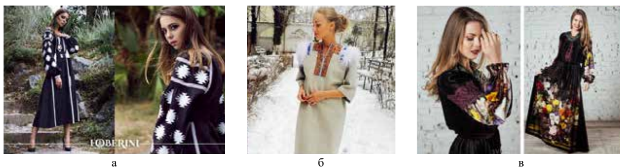
Рис. 3. Прототипи сучасного етностилу в Україні

Орнаментика в Україні має довгу історію, важливу культурну спадщину та глибокі традиції. Козацька державність і український орнамент допомагають визначати національний характер та виражати національну ідентичність. У теперішній час дизайнери і художники використовують ці традиції для створення унікальних та сучасних об'єктів. (Чегусова, Кара-Васильєва, 2005: 280) Використання орнаментів в дизайні додає виробам розкіш, елегантність та унікальний характер. Орнаменти можна успішно впровадити в різно-