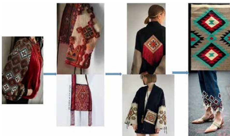
Рис. 5. Трансформація українського національного орнаменту в сучасний дизайн