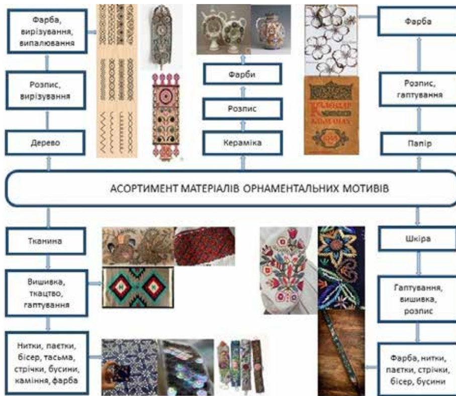
Рис. 2. Систематизація асортименту матеріалів орнаментальних мотивів на різних поверхнях

Розглядаючи сучасний етностиль в Україні можна з впевненістю сказати, що він стрімко розвивається та набуває широкого розповсюдження на українському ринку. Розглядаючи сучасний український дизайн можна зробити висновки, що українська орнаментика багатогранна і має певні характерні риси притаманні лише українським орнаментам. Етномотиви українських національних орнаментів використовують на одязі, взутті, аксесуарах та іншому. З цього можна стверджувати, що не форма на якій знаходиться орнамент виражає етностиль, а саме орнаменти виражають стиль українського етно та надають будь-якій речі характерних етнічних рис. Розглядаючи крій можна з впевненістю стверджувати, що україн-