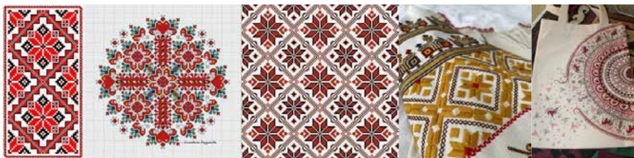
Рис. 1. Стрічкові, розеткові, сітчасті орнаменти

Багато художників використовують українські мотиви у своїх творах. Це може бути як традиційне зображення, так і абстракція на основі українського орнаменту. Українська орнаментика є важливим елементом культурної спадщини, який живе та розвивається в сучасному світі через призму робіт творчих особистостей, які віддані збереженню та розвитку національного характеру.