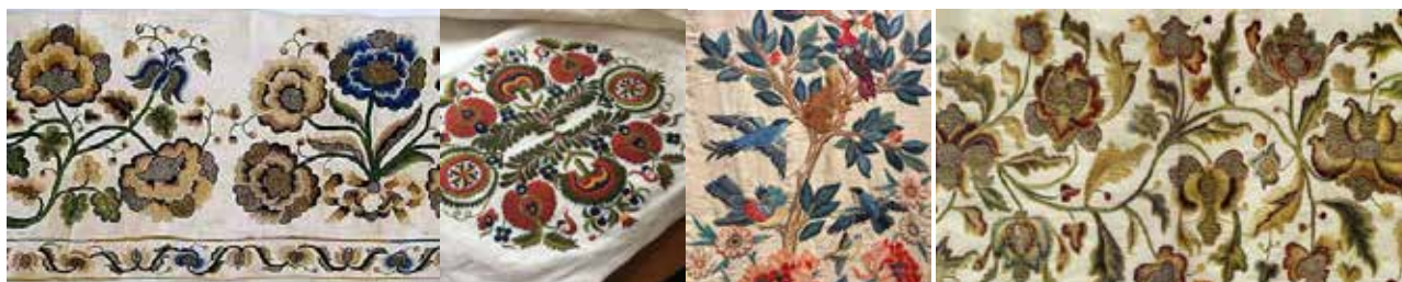
Рис. 9. Барокова вишивка козацької старшини XVII–XVIII століття за матеріалами чернігівського історичного музею ім. В. В. Тарновського, фотографії з книги В. Зайченко «Вишивка козацької старшини XVII–XVIII століть»