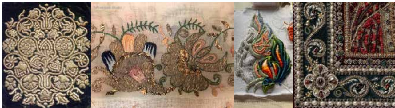
Рис. 7. Вишивка XVII–XVIII століття, гаптування у прикріп за матеріалами чернігівського історичного музею ім. В. В. Тарновського, фотографії з книги В. Зайченко «Вишивка козацької старшини XVII–XVIII століть техніки»

Окрему ланку займає вишивка створена на дорогих та специфічних по фактурі тканині як шовк, парча, оксамит на яких використовували спеціальну техніку шитва – гаптування, яка виконується шовковими та металевими нитками, блискітками, мереживом, фольгою, коштовним камінням (рис. 7). Як описано в працях дослідників (Гаптування, тобто вишивання пряденим золотом (сріблом), пов'язане виключно з побутом панівних верств населення – козацької старшини та духовенства. Воно виникло на основі народного вишивання, що здавна поширене в слов'янських народів. Золоту чи срібну нитку накладали поверх тканини на площу узору паралельними рядами і прикріпляли її в багатьох місцях шовковою ниткою. Це так звана техніка гаптування «в прикріп». Археологічні знахідки доводять, що цей вид шитва був відомий на Україні дуже давно,