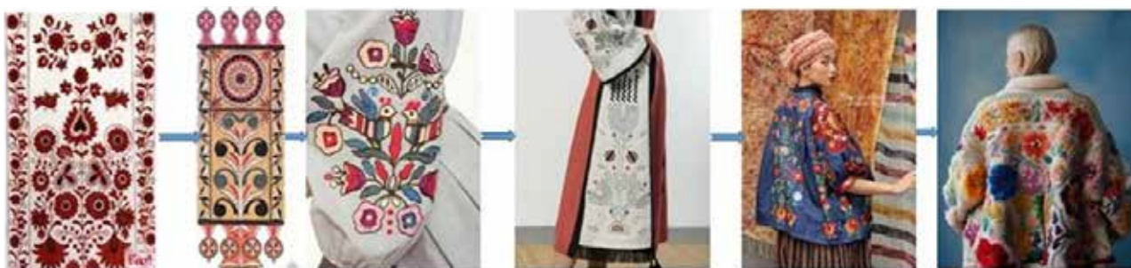
Рис. 4. Трансформація українського національного орнаменту в сучасний дизайн

Аналіз досліджень. Аналіз публікацій останніх років за напрямком етнодизайну досить активно розвивається але не всі теми повноцінно розкриті. Більшість особливостей досліджень українського етнодизайну полягає в аналізі особливостей елементів культурної спадщини. Безперечно це вагомий внесок в розвиток етнокультур та важко уявити зростання етнодизайну без рекомендацій та можливостей застосування використання творчого першоджерела в процесі пошуку дизайнерських рішень. Неможливо розвивати та збагачувати сучасний український етностиль та етнодизайн без вивчення та аналізу досвіду наших пращурів але необхідно вміти і розуміти шляхи використання цих глибинних знань в сучасному дизайні. Їх багатотисячолітні надбання – це наша спадщина та великий пласт для черпання натхнення для створення сучасних стилів та напрямків. З часів незалежної України з'явилося багато видань та дослідників які поклали міцний фун-