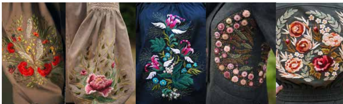
Рис. 8. Вишивка гладдю на різних поверхнях

Барокко відомий своєю розкішшю та деталізацією. Український орнамент в бароковому стилі може включати багато деталей, прикрас, зігнутих ліній та витончених форм (рис. 9). Він часто використовує складні, витончені структури та композиції. Український орнамент в бароковому стилі може мати багатшарову або багаткомпонентну структуру, де різні елементи взаємодіють між собою, використовуються кружева та складні переплетення. Українські орнаменти в цьому стилі можуть включати витончені геометричні мотиви та замкнуті візерунки, часто використовуються рослинні мотиви, такі як ліани, квіти та листя, для створення багатшарових та вишуканих композицій. Український орнамент в бароковому стилі може використовувати традиційні українські квіткові та рослинні елементи, включати складні геометричні форми та витончені лінії. Український орнамент може поєднувати ці геометричні елементи з традицій-