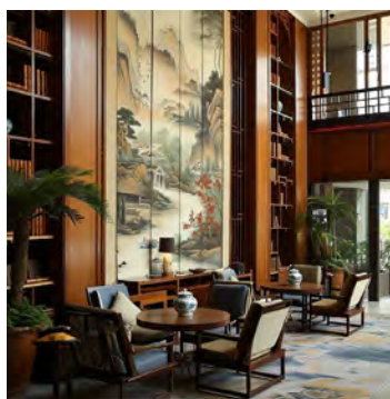
Іл. 2. Інтер'єр бібліотеки. Пейзажний розпис підкреслює ось симетрії стіни і створює зорову ілюзію «перетікання» внутрішнього простору в природне середовище