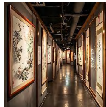
Іл. 3. Інтер'єр громадської художньої галереї. Оформлення периметру стін метричними рядами розписів, які утворюють візуальне розширення вузького лінійного простору