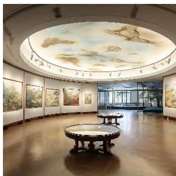
Іл. 4. Культурний музейний простір. Центричність простору підкреслена розписом круглого плафону та панорамою пейзажних розписів по периметру стіни