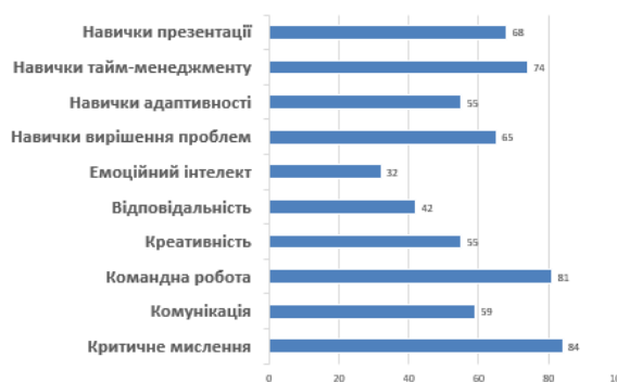
Рис. 2. Відповіді респондентів

Критичне мислення є найбільш важливою навичкою, за оцінкою здобувачів освіти. Це підкреслює необхідність вміння аналізувати інформацію, формулювати аргументи та робити обґрунтовані висновки. Командна робота займає друге місце, що свідчить про важливість співпраці та ефективної взаємодії з іншими у сучасному освітньому та робочому середовищі.