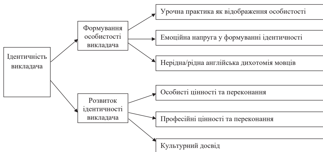
Рис. 1. Формування ідентичності майбутнього педагога іноземної філології

Формування особистості та розвиток ідентичності має вплив на подальшого викладання та навчання інших здобувачів освіти. Для успішного навчання іншомовного спілкування майбутні викладачі повинні вміти описувати якості традиційної культури спілкування (Chiu et al., 2024). Ця культура включає в себе рівне мовлення між усіма учасниками, тактовний і цікавий обмін думками між мовцем і слухачем, а також дотримання культури ввічливості та поведінки.