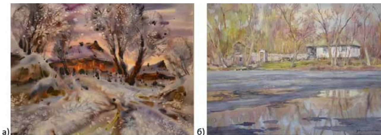
Рис. 7. а) Марина Рожнятовська, «Перед Різдвом», 2014; б) Віктор Михайличенко, «Весна. Чорний лід», рік створення невідомий

тектуру Кримського півострова, де двоповерхові світлі будиночки з ракушняка та обмаль рослин довкола подвір'я – типова картинка (рис. 8 а).