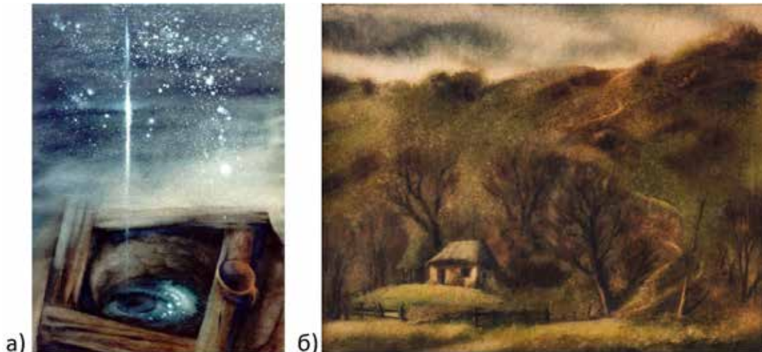
Рис. 1. Тетяна Павлик: а) назва й рік створення невідомі; б) «Покинуте гніздо», 1996

зиційні досконалість, неймовірно щиро описує сільське буття (рис. 2 б).