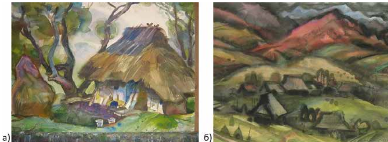
Рис. 5. а-б) Василь Скакандій, назва й рік створення невідомі

суцільну гармонію сільської вулиці з зимовою стихією. Ранні синьо-бузкові сутінки, дим із комина, відблиски світла на сніговому покриві, некваплива людська хода, ритмічно зображені сніжинки – усе це, так тонко підмічене автором, існує в єдиному ритмі з зимовою порою (рис. 6 б). Це той час, коли вся землеробська праця стала на паузу, згідно з давнім союзом українців із солярним циклом. Така статичність надовго залишається в пам'яті художників і, як у такому випадку, «проситься» на папір.