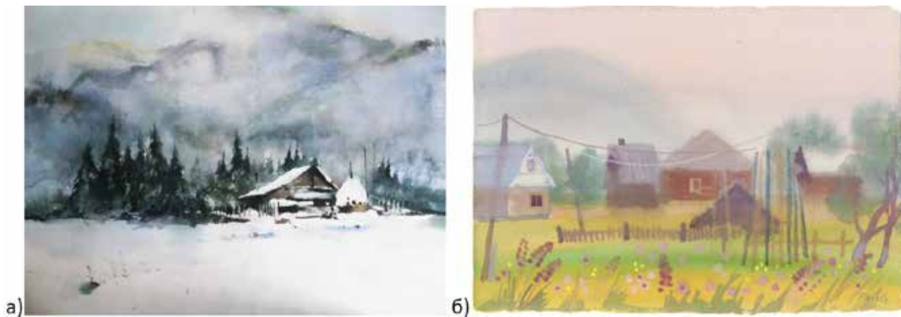
Рис. 9. а) Олександр Карпан, «Зимовий день у Сколе», 2015; б) Людмила Корж-Радько, «Туман в Карпатах», 2013

зі своїм характером, який формують будівлі, природа й люди.