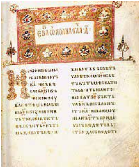
Рис. 1. Сторінка з «Остромирового Євангеліє»

Тоді, коли вже графічне мистецтво XVII–XVIII століть не обмежується лише релігійними мотивами. Творчість митців все більше орієнтується на світські мотиви та національно-патріо-