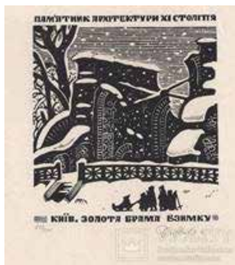
Рис. 15. І. Батечко