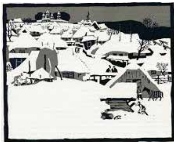
Рис. 13. С. Адамович

лістичного стилю, намагаючись зберегти творчу свободу в умовах офіційної ідеології. Після отримання незалежності в Україні станкова графіка стала площиною для різноманітних експериментів і плюралізму стилів і технік (Лагутенко, 2011: 100).