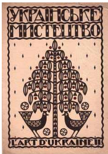
Рис. 11. В. Кричевський