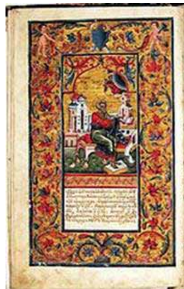
Рис. 3. Пересопницьке Євангеліє (1556–1561)