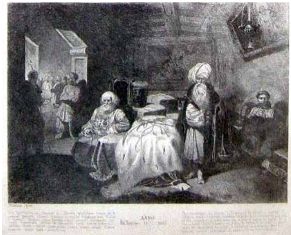
Рис. 6. Т. Шевченко «Дари Чигирина», 1844 р.

активно досліджували українське село, зображували обряди, традиції та звичаї. Саме тому, в контексті національного відродження та боротьби, станкова графіка стала важливим інструментом для підтримки патріотичних ідеалів та національної самосвідомості.