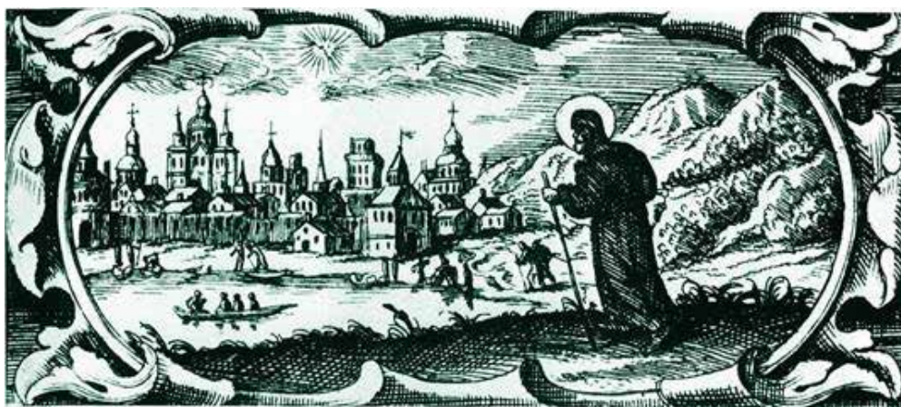
Рис. 5. Брати Тарасевичі

Важливо зазначити, що темами станкової графіки XIX століття була народна культура, історичні події, пейзажі та побутові сцени. Художники