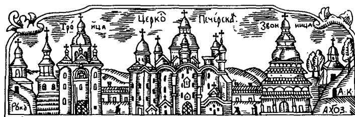
Рис. 4. Гравюра з ініціалами майстра

тичними настроями. Графіка виходить на новий рівень своєї майстерності. Мережа друкарень росте, а з ними та з'являються нові митці, які все більше працюють на міді та у техніці офорт. Наприклад, майстри різця брати О. та Л. Тарасевичі використовували надбання європейських, створюючи власний стиль (рис. 5).