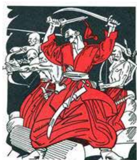
Рис. 14. А. Базилевич

Сучасні українські художники станкової графіки активно реагують на соціально-політичні зміни, відображаючи їх у своїх творах. Теми від ідентичності до сучасної політики й культурних трансформацій стають центральними. Митці активно використовують цифрові технології та гібридні підходи для створення станкових графічних робіт, поєднуючи традиційні та інноваційні методи. Наприклад, І. Селеменев (рис. 16), В. Єрко (рис. 17).