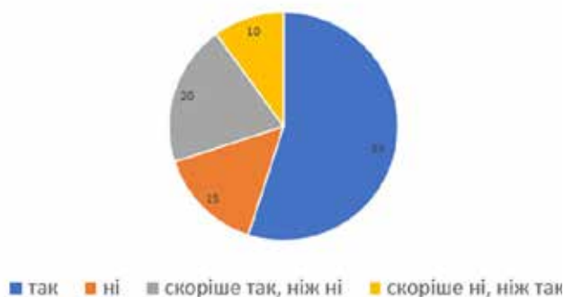
Рис. 2. Результати опитування здобувачів освіти

Чи стикаєтеся ви з якимись труднощами при впровадженні інноваційних методів у процес навчання?