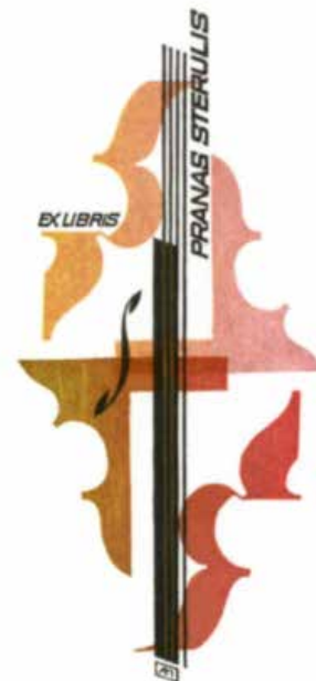
Рис. 5. Пугачевський А. Екслібрис П. Стеруліса.