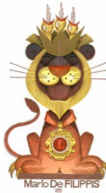
Рис. 3. Пугачевський А. Екслібрис Л. Богерта. Екслібрис Маріо де Філіппіса. Кольорова гравюра на пластику. 1994 г.

ж результативно – за екслібрис П. Стеруліса (рис. 5), створений для Міжнародного конкурсу «Музика. Танець. Пісня» був удостоєний Призу – Литовського народного культурного центру.