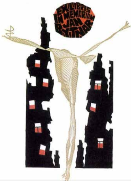
Рис. 4. Екслібрис Ж. Бітнера «Варшавське повстання». Кольорова гравюра на пластику. 1994 р.

У 1995 р. бельгійська «Графія» знову віддала митцеві нагороду, і його наступні кроки до переможного Олімпу датовані вже 1996 р. Він приніс художнику медаль на II Міжнародному огляді ксилографічного та ліногравюрного екслібрису в