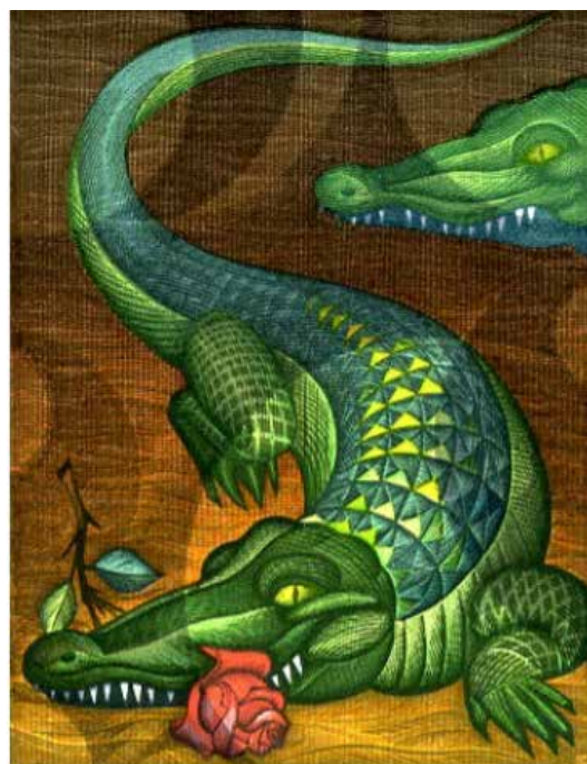
Рис. 7. Пугачевський А. «Кохання». Кольорова гравюра на пластику. 1998 р.

Висновки. Творчість Аркадія Пугачевського є одним з тих наріжних каменів, з яких зарубіжний глядач починав формувати судження про нову мистецьку Україну у галузі друкованої графіки. Його феномен є доказом того, що не офіційними червоними доріжками устелено шлях до визнання, передусім – у зарубіжний арт-простір, де практично неможливо отримати перемогу корупційним шляхом чи завдяки офіційному статусу. Багато країн світу високо оцінили творчість київського митця. В тому числі – правом