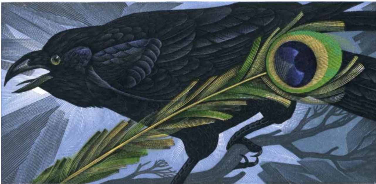
Рис. 8. Пугачевський А. «Павич». Кольорова гравюра на пластику. 2001 р.

проведення персональних виставок, запрошеннями. Але у себе на Батьківщині він і сьогодні залишається ще не відкритим для широкого загалу, не оціненим повною мірою, мало відомим. На жаль, історія мало чому вчить – митці, як і раніше, часто залишаються неоціненими у себе на Батьківщині, тоді як зарубіжний культурний простір віддає належне їх таланту. Таке ставлення до культурної еліти у державі завжди спричиняло відтік мистецької спільноти за кор-