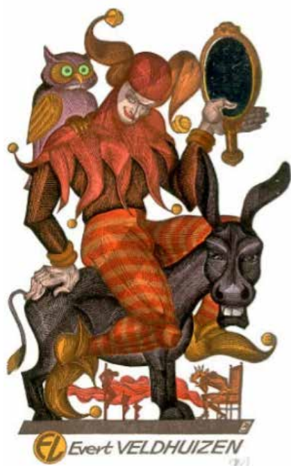
Рис. 6. Пугачевський А. Екслібрис Е. Вельтхаузена. Кольорова гравюра на пластику. 1996 р.

У 1998 р. Аркадій Пугачевський знову розширив географію своїх творчих перемог, отримавши Другий почесний приз на Міжнародному конкурсі «Миша Кетті» у Люксембурзі та Музейний приз від японців – на Токійському Міжнародному триєннале міні-естаampu потрапила в коло переможців його кольорова гравюра «Кохання» (рис. 7). З усіх аркушів, що здобули призи, мабуть, це один з найнетиповіших, бо не є книжковим знаком.