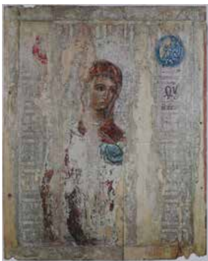
Іл. 1. Ікона «Богородиця Одигітрія». XVI ст. З ц. Покрови Пресвятої Богородиці с. Попелі Дрогобицького р-ну Львівської обл. Дошка, темпера, сріблення. 96 × 76 × 2.5 см. Музеї Ватикану, Держава-місто Ватикан (Українське сакральне мистецтво, 2005: 57)

Постановка проблеми. Предметом дослідження є ікона «Богородиця Одигітрія» з села Попелі Дрогобицького району Львівської області (Іл. 1). Образ «Богородиці Одигітрії» (96 × 76 × 2.5 см) є взірцем темперного іконопису, що нині належить до колекції Музеїв Ватикану (Musei Vaticani) Держави-міста Ватикан. Музеї Ватикану також зберігають копію-реконструкцію із відтворенням пошкоджених ділянок оригінального образу. Першим відомим нині місцем побутування образу була церква Покрови Пресвятої Богородиці в селі Попелі. Далі твір, що мав значні втрати фарбового шару та ґрунту, зберігався в колекції монастиря Святого Обручника Йосифа монахів студійського уставу «Студіон» у Львові. Фізико-хімічне дослідження ікони та супутні реставраційні заходи було здійснено у січні 2001 р. фахівцями Національного науково-дослідного реставраційного центру України. У червні цього ж року проєкт «Івану Павлу II Ікона від Львова» було презентовано в галереї КМЦ «Дзига» у місті Львів. Ікону «Богородиця Одигітрія» з села Попелі також було представлено в межах виставки однієї ікони в НМЛ ім. Андрія Шептицького.