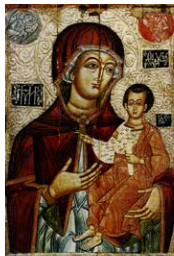
Іл. 5. Ікона «Богородиця Одигітрія з похвалою». Друга половина XVI ст. Походження невідоме. Дошка, темпера, сріблення, рельєф. 114.5 × 87 × 2.5 см. (загальні виміри твору). НМЛ (Гелитович, 2005: іл. 20)