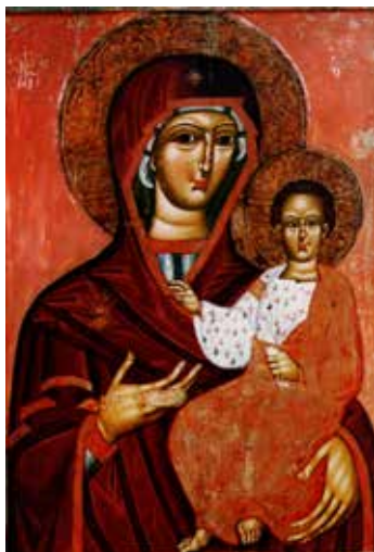
Іл. 6. Ікона «Богородиця Одигітрія з похвалою». Фрагмент («середник» ікони). Перша половина – середина XVI ст. З церкви Різдва Богородиці у с. Підліски. 112.5 × 77 × 2.2 см. (загальні виміри твору). НМЛ (Гелитович, 2005: іл. 21)

Вагомим чинником мистецтвознавчої атрибуції твору іконопису є характер його декоративної оздобы. Ікона «Богородиці Одигітрії» має рельєфне декорування німбів (у вигляді бігунця), решіткоподібну оздобу тла. Орнаментация тла ікони «Богородиця Одигітрія» з села Попелі складається з подвійних переплєтених смуг. В середині «квадратів-віконць» решітки представлені стилізовані квіти-розети. Смуги декору перетинаються під прямим кутом та зміщені таким чином, що утворюється структура, подібна до переплетення полотна. Михайло Драган класифікував тип орнаменту, притаманного для оздобы тла досліджуваного нами образу, як «гравірований візерунчастий мотив». Дослідник виокремив таку орнаментацию в образах з колекції НМЛ (раніше ЛМУМ), датованих вчешнім в межах XVI ст. (Іл. 7): «Богородиця Одигітрія з похвалою» з села Камінка 3 , «Свята Параскева П'ятниця» з села Радруж (Драган, 1970: 200).