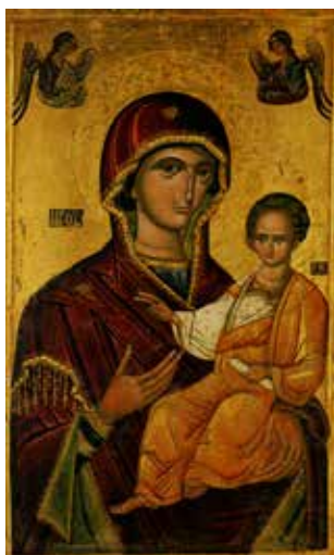
Іл. 3. Ікона «Богородиця Одигітрія з похвалою» з церкви Преображення Господнього м. Белз. Фрагмент («середник» ікони). Перша половина XVI ст. Дошка, темпера, золочення. 137 × 97 × 3.5 см. (загальні виміри твору). НМЛ (Міляєва, Гелитович, 2007: іл. 259)

Окремо варто відзначити близьку за образними характеристиками ікону «Богородиці Одигітрії з похвалою» з церкви Різдва Богородиці у селі Підліски (НМЛ), датовану першою половиною – серединою XVI ст. (Іл. 6). Вгадуються іконографічні аналогії між названою іконою та образом «Богородиці Одигітрії» з села Попелі завдяки подібності мигдалевидної форми та елементів рисунку виразних очей Богородиці, тричастинному членуванню лінії носа.