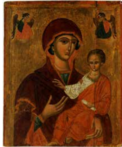
Іл. 4. Ікона «Богородиця Одигітрія». Середина XVI ст. З ц. Святого Дмитрія у с. Красів. Дошка, темпера, золочення. 91.5 × 77.5 × 3.5 см. НМЛ (Міляєва за уч. Гелитович, 2007: іл. 257)

Прикметною спільною рисою є детально виписане в тричвертному повороті зображення носа із характерним краплеподібним крилом. З огляду на зауважену деталь, пропонуємо додати до іконографічно споріднених пам'яток ікону «Богородиці Одигітрії з похвалою» невідомого походження з колекції НМЛ (Іл. 5), що датована другою половиною XVI ст. (Гелитович, 2005: 63). Очевидною вказівкою на те, що твір належить до більш пізнього часу є зображення застібки-фібули на мафорії Богородиці, притаманної для західноєвропейських образів Пресвятої Діви.