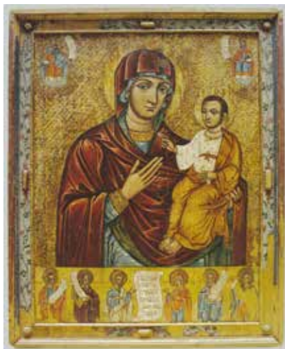
Іл. 8. Ікона «Богородиця Одигітрія з похвалою». Початок XVII ст. Походження невідоме. Дошка, темпера, сріблення, рельєф. 101 × 80 × 1,5 см. НМЛ (Гелитович, 2005: іл. 54)

лення образотворчості XVII ст. а саме – тяжіння до натуралізму в малярстві лику, а також – збагачення декоративної складової шляхом додавання накладного обрамлення з живописною орнаментатією та рельєфними прикрасами.