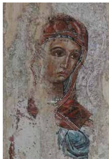
Іл. 2. Ікона «Богородиця Одигітрія» з с. Попелі. Фрагмент

Ми спостерігаємо темну карнацію лику Богородиці із контрастними білильними висвітленнями, котрі моделюють надбрівні валки, та виділяють немов освітлену променем трикутну ділянку від куточків очей до підборіддя (Іл. 2). Присутні також і білильні оживки, котрі вправними лініями наслідують форму здійнятих брів та формують підочні борозни. У поєднанні з чітким контуренням овалу лику, брів, мигдалевидних каріх очей, ретельно виписаного носа, уст та підборіддя, партії білильних висвітлень підсилюють загальну виразність лику. Живописне відлуння візантійської образот-