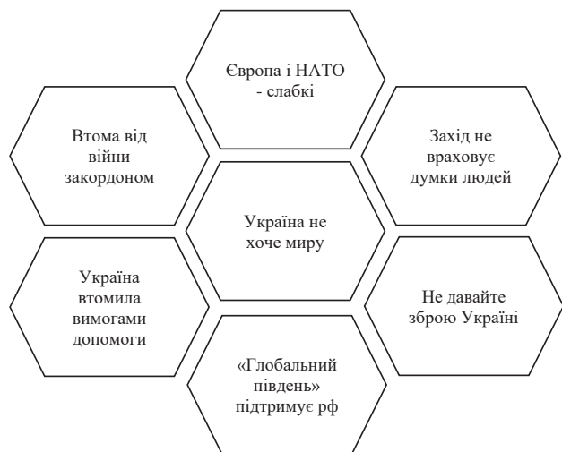
Рис. 4. Найпоширеніші аргументи проти допомоги Україні в 11 державах Азії, Африки і Південної Америки (Детектор медіа, 2023)

Подані на Рис. 3,4,5 дані були сформовані протягом періоду «з 19 грудня 2022 р. по 22 лютого 2023 р. Увесь цей час аналітики й аналітикині LetsData і «Детектора медіа» готували щотижневі звіти про публікації про Україну в медіа 36 країн Європи, Азії, Африки й Південної Америки» (Детектор медіа, 2023). Тримісячний моніторинг «2,7 тисячі найпопулярніших медіа 11 країн Азії, Африки і Південної Америки» (Радіо Свобода, 2024) дає змогу предметно