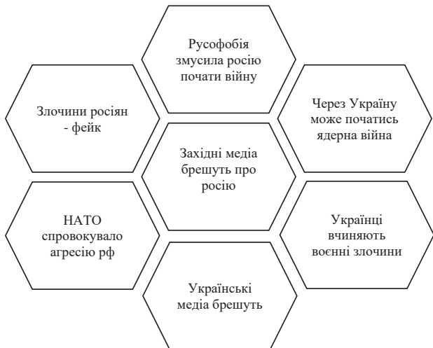
Рис. 3. Найпоширеніші звинувачення прихильниками Росії України і її партнерів у 11 державах Азії, Африки і Південної Америки (Детектор медіа, 2023)

формації в основі якого є спотворення об'єктивної дійсності завдяки інструментам інформаційного впливу. Така стратегія обумовлюється потребою у викривленні реальності на користь інтересів самої росії. Щоб загальна картина світу, яку подають медіа виглядала у потрібному для рф світлі.