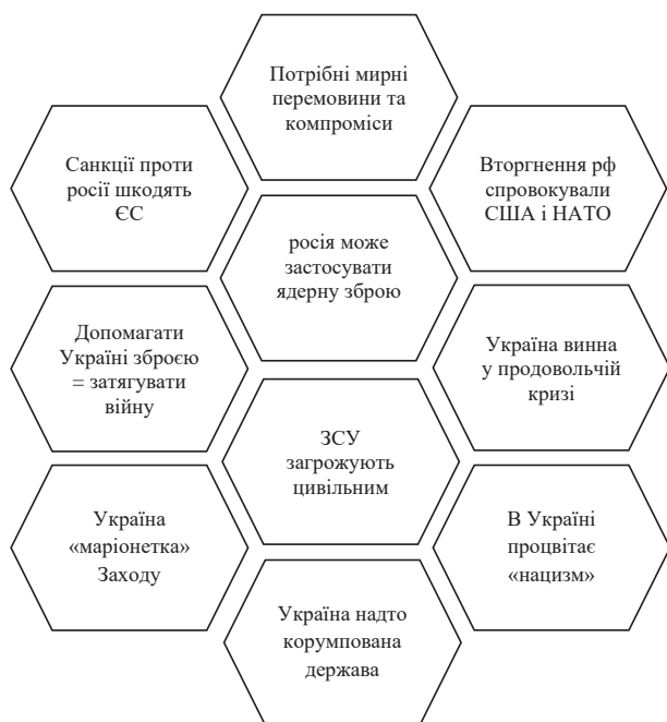
Рис. 2. Найпоширеніші російські пропагандистські наративи в Європейських медіа (Lviv Media Forum, 2023)

Фактично завдяки таким особам і організаціям в зарубіжних мас-медіа поширюються тези (див. Рис. 2), котрі сприяють формуванню викривленого сприйняття перебігу російсько-української війни. Дослідники називають їх російськими або проросійськими наративами. Тобто це певні сталі формулювання, в яких прослідковується ідеологічна спорідненість з траєкторією російської пропаганди. Переважно вони є однотипними, на чому й ловлять зв'язок журналісти-розслідувачі, мова йде про так звані «методички», шаблони російської пропаганди, згідно з якими спрямовується дезінформаційна діяльність.