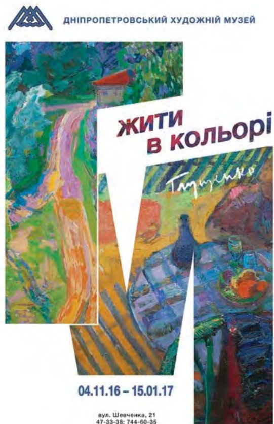
Рис. 2. Афіша виставки «Жити в кольорі». Дніпровський художній музей (2016–2017)

У галереї «Ню Арт» у 2018 р. відбулась виставка з 66 робіт Миколи Глуценка «Штрихи до портрета художника» з приватних колекцій. Періодизація олійних, акварельних та графічних робіт охоплювала 1920-і–1970-і рр. Ажіотаж довкола