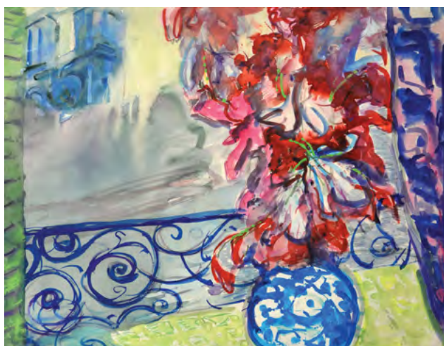
Рис. 8. Микола Глущенко «Квіти. Вид на Нотр-Дам де Парі». Папір, гуаш, акварель (1970-ті)

У тому ж 2021 р. під час передаукційної виставки ювілейного 50-го аукціону колекційного класичного та сучасного мистецтва «Classic & Contemporary art» було представлено натюрморт Миколи Глущенко «Квіти. Вид на Нотр-Дам де Парі», приналежного до пізнього періоду його творчості, акварельні роботи якого були особливо декоративними й витонченими (Рис. 8) (Глущенко Микола. Аукціонний дім «Goldens», 2021)