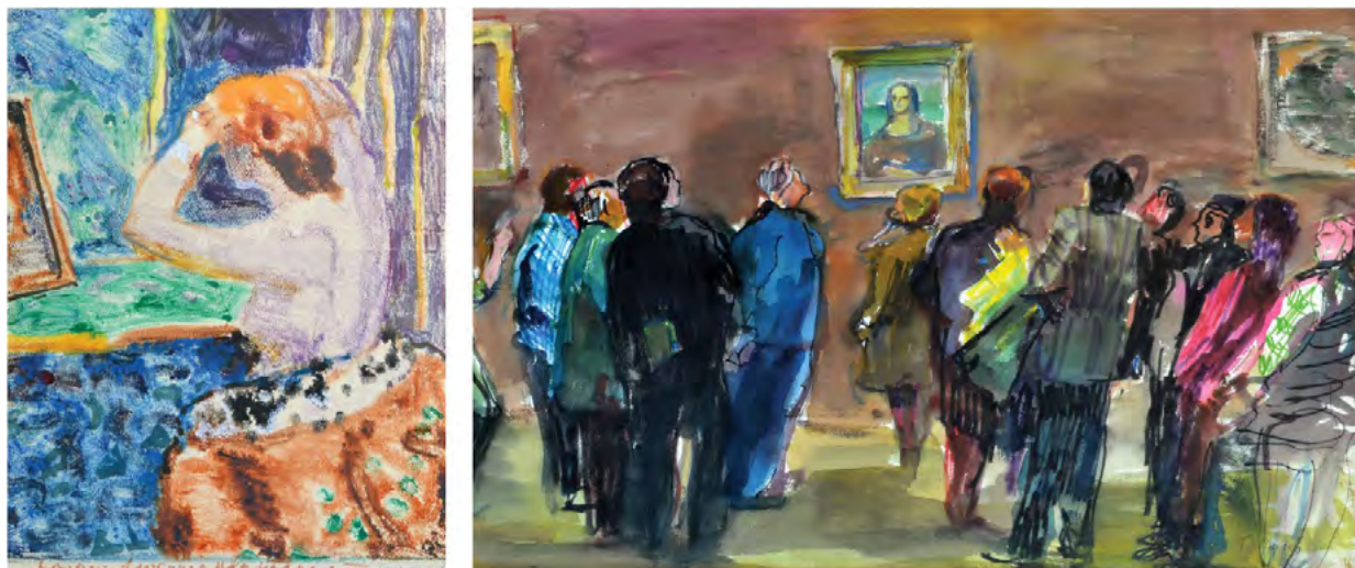
Рис. 7. Микола Глущенко. Зліва на право: «Перед дзеркалом». Папір, монотипія, акварель (кін. 1960-х); «В Луврі». Папір, фломастер, акварель (1976)

Марчука, Олекси Новаківського, Олександра Ройтбурда, Олега Тістола, Івана Труша й інших митців можна було побачити й кілька робіт знакового колориста Миколи Глущенко. Зокрема, акварелі «Перед дзеркалом» та «В Луврі» (Рис. 7). Остання є доволі рідкісним зверненням художника до жанрових сцен.