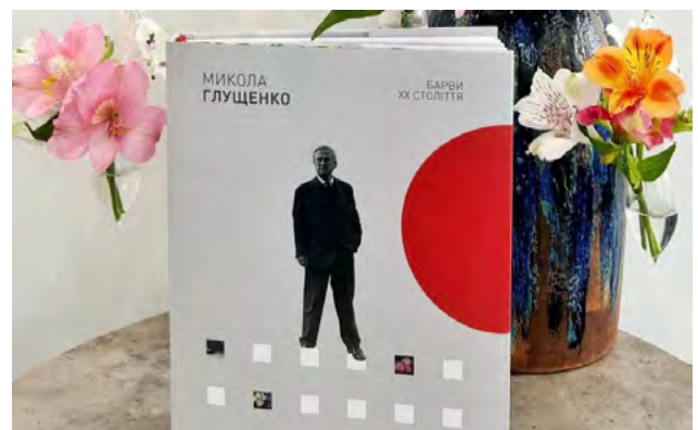
Рис. 6. Презентація каталогу робіт Миколи Глуценка «Барви ХХ століття», м. Київ (2023)

Експонований на виставці пейзаж «Віллен-сюр-Сен» (Рис. 5) належить до французького періоду життя та, навпаки, неквалітивний, дещо суворий своєю концентрацією холодної колірної палітри, особливо зосередженої на середньому композиційному плані. За словами організаторів, виставка такого масштабу проходила у Львові в 1935 р. – «Через роботи показано всі етапи життя Миколи