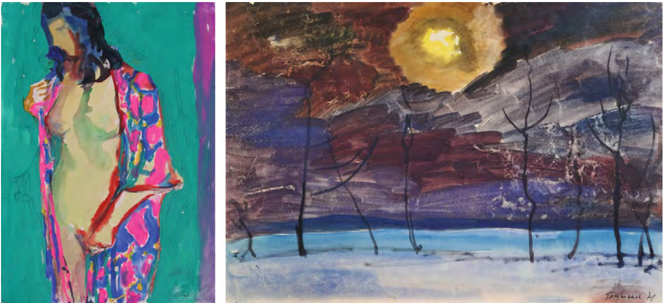
Рис. 1. Микола Глущенко (папір, акварель), 1971. Зліва на право: «Оголена»; «Зимова ніч»

експлікацій була побудована на висловах художника – вони доповнювали кожен з понад 60 робіт з музейної збірки, приналежних переважно до пейзажного жанру та подарованих автором в 1974 р. Увазі відвідувачів було запропоновано олійний та акварельний живопис, графіку, а також, роботи в змішаній техніці (фломастери й акварель, туш та акварель).