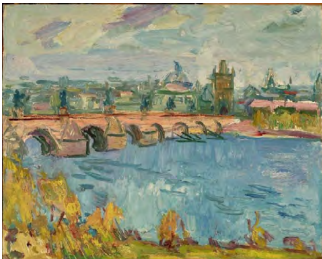
Рис. 3. Микола Глущенко «Прага. Карлів міст». Папір, акварель (1965). Проект «Остання свобода», м. Одеса (2020)

проекту підтвердив неухильно висхідний інтерес до постаті художника, самобутній стиль якого формувався в часи проживання в Західній Європі. Переважна більшість творів була придбана під час аукціонів у Парижі, Нью-Йорку та інших мистецьких центрах світу.