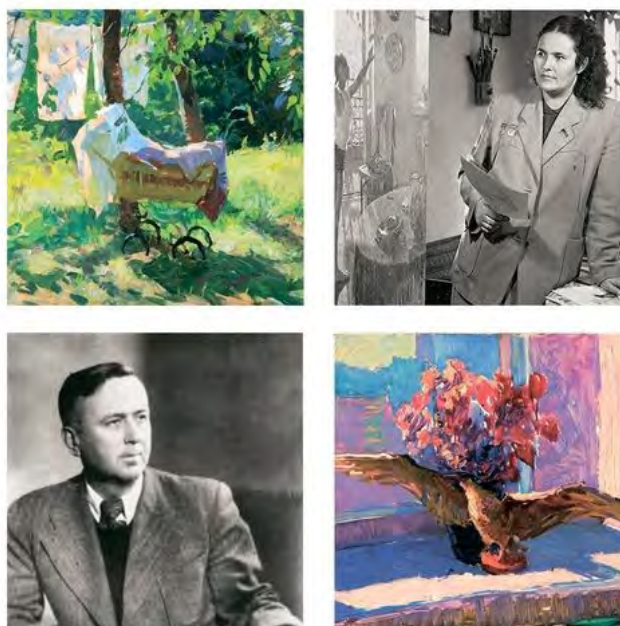
Рис. 9. Афіша виставки «Колір як мова», м. Київ (2023)