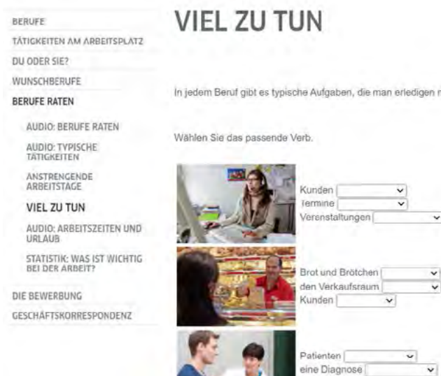
Рис. 3. Приклад вправ з вивчення нової лексики. Розробник: Зуєнко Н.О.

страх, метою вивчення дисципліни є набуття іншомовних компетентностей, оволодіння мовними навичками для успішного спілкування в міжнародному професійному середовищі, засвоєння професійної лексики та термінології для роботи майбутніх фахівців сфери обслуговування (готельно-ресторанна справа).