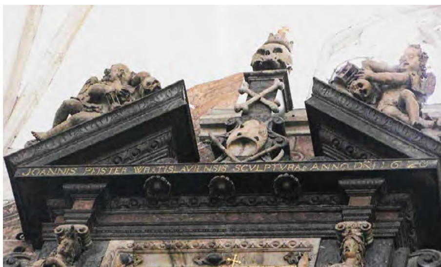
Рис. 1. Фрагмент з надгробку Януша з роду Острозьких та його дружини Сузанна Середі у латинській Катедральній базиліці в місті Гарнові (1620)

Вибір Миколи Синявського розбудувати місто із замком був не випадковим, розташований на берегах двох річок, місцевість оточена невеликими пагорбами та долиною із заплавами річок, між якими розташувався замок, доступ до міста тільки з східної сторони, що має важливе стратегічне значення для оборони та контролю території. Добре спланована фортифікаційна систем із використанням природніх особливостей ландшафту, створювала неймовірний захист для жителів, замок розташувався біля однієї із заплав ріки Золотої Липи.