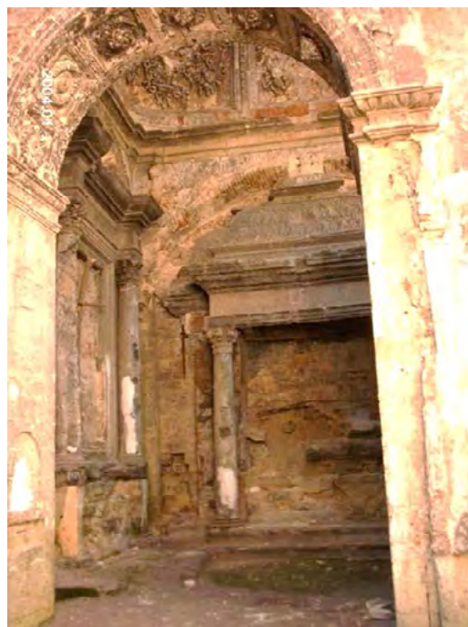
Рис. 2, 3. Надгробок Адама Єроніма Сенявського, фото 30х років і 2004 року