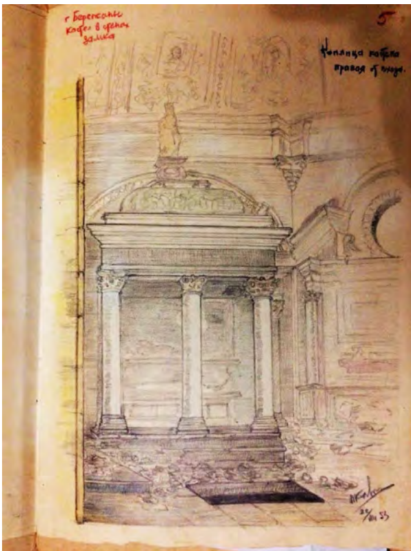
Рис. 6. Графічне зображення надгробку Адама Єроніма Сенявського, папір, олівець, 1953 року.