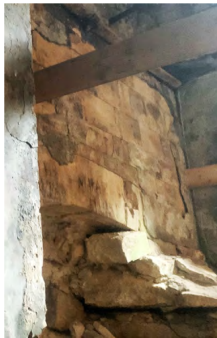
Рис. 5. Фрагмент стіни з нішею та лучковою аркою за саркофагом із тесаних блоків та залишків чорного тиньку, (фото автора 2024 р.)

Сам надгробок вмонтований в стіну із великою аркою, що нішу, арка мурована з цегли та була декорована стюковими квітковими розетами, подібних до внутрішнього оздоблення вхідного порталу західної каплиці, декоровані розети відсутні. Стіна великої аркової ніші мурована із прямокутних тесаних вапнякових блоків, шви між блоками мінімальні, також витримана рядність мурування блоків, аналогічним чином в центральній стіні за саркофагом була оздоблена ще одна невелика ніша з лучковим склепінням. виготовлена із тесаних блоків, які пізніше були отиньковані під чорний мармур. Частина стіни, що над великою нішею отиньковані із іншими стінами каплиці в червонуватий-охристий колір (рис. 5).