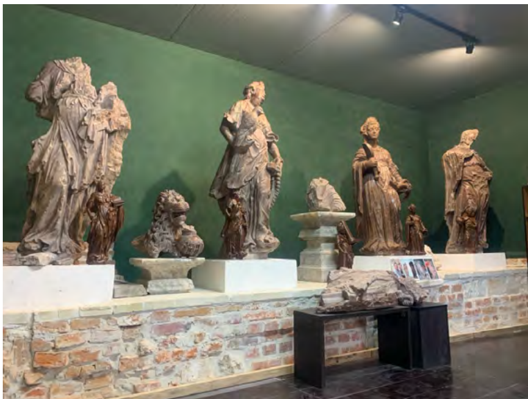
Рис. 7. Алгоритичні мармурові скульптури з надгробку Адама Єроніма Синявського. Експозиція створена в 2024 року

– один підтримуючи саркофаг різьблений лев.