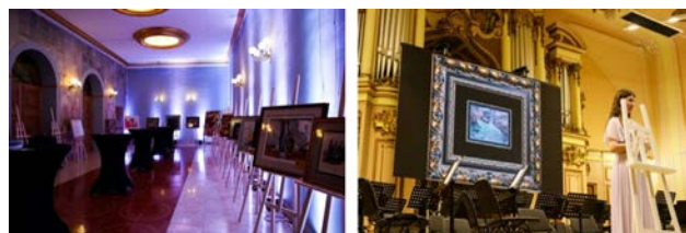
Рис. 6. Експозиція й торги благодійного аукціону «Сила мистецтва vol.3»

У квітні 2023 р. вже традиційно в Львівській національній філармонії імені Мирослава Скорика відбувся благодійний аукціон «Сила мистецтва vol.3» (рис. 6), вартість вхідного квитка становила 1800 грн.