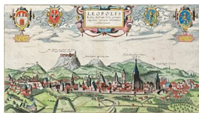
Рис. 5. Абрагам Гогенберг «Панорама Гогенберга». Мідьорит, акварель (1617). Лот № 8 благодійного аукціону «Сила мистецтва vol.2» (22.10.2023)

У жовтні того ж року в Львівській національній філармонії імені Мирослава Скорика благодійний аукціон «Сила мистецтва vol.2» було організовано знову, за партнерської участі інформаційної платформи «Ветеран медіа» та Академічного симфонічного оркестру «INSO-Lviv»: зібрано 2 млн 200 тис. грн. на придбання безпілотного літального комплексу VTOL «FreeUA» для 103-ї окремої бригади Сил територіальної оборони імені митрополита Андрея Шептицького Збройних Сил України (На благодійному аукціоні «Сила мистецтва vol.2», 2023). Серед 21 лотів, лотом № 8 (рис. 5) є робота визначного німецького художника гравера й видавця Абрагама Гогенберга (1578–1653), ілюстратора «Атласу міст земного світу», що видавався родиною митця з 1572 р. Цей лот є реалістичним деталізованим кольоровим зображенням міської панорами середньовічного Львова. Це перше друковане зображення міста. Стартова ціна лоту становила 6 тис. дол.