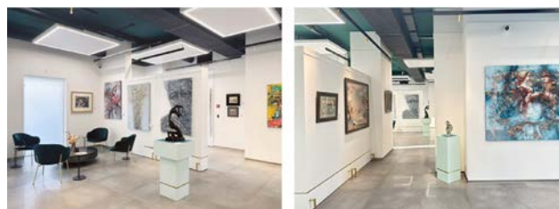
Рис. 1. Виставкові зали Львівського Дому Мистецтва

У прагненні зробити вітчизняне мистецтво більш доступним, не обмежуючись стінами музею чи художньої майстерні, засновники галереї обрали за мету демонстрацію майстерності кожного з митців та забезпечення їм «...відкритого простору для реалізації» (Львівський Дім Мистецтв, б.д.). Рішення розпочати роботу Львівського Дому Мистецтв саме в часи активної фази військового конфлікту вони пояснили тим, що в вітчизняному мистецтві вбачають перспективи як зараз, так і після перемоги України. Разом із тим, наголосили, що для того, аби національний артринк розвивався, він має «...ставати прозорішим, відкрито озвучувати ціни, демонструвати колекції у мережі, розвивати вторинний ринок – від покупця до покупця» (Мистецтво – це актив..., б.д.). Таким чином, вся концепція діяльності Львівського Дому Мистецтв побудована на відкритості та готовності вести діалог із митцями, колекціонерами, журналістами та всіма відвідувачами, які є потенційними покупцями експонованих в галереї творів живопису, графіки та скульптури. Для цього на сайті в привітній формі лаконічно роз'яснено місію галереї, яка є осередком, де знаходять один одного діячі мистецтва та його шанувальники, «...колекціонери й експерти, інвестори й любителі...». У Львівському Домі Мистецтва наявна постійно діюча експозиція (рис. 1) з вільним входом для всіх бажаючих, які можуть придбати будь-який твір з наявних на момент відвідування. У зв'язку з цим експозиція регулярно доповнюється новими творами (Шведа, 2023).