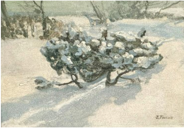
Рис. 7. Іван Труш «Зима». Картон, олія (1928). Лот № 28 благодійного аукціону «Сила мистецтва vol.3» (13.04.2024)