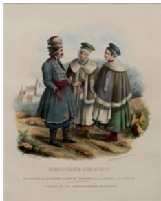
Рис. 8. Ян Левицький «Жителі Львова». Літографія, акварель (1841). Лот № 16 благодійного аукціону «Сила мистецтва vol.3» (13.04.2024)

Лот № 16 – акварельна літографія Яна Левицького (1795–1871) «Жителі Львова» (рис. 8), з художнього альбому «Одяг польських народів», оскільки митець цікавився національними культурами, які свого часу зазнали впливу польської культури. Композиційним центром роботи є постаті трьох міщан, де автором змальовані найдрібніші деталі їхніх строїв, завдяки чому робота є цінним історичним джерелом, що розповідає про життя міста середини XIX століття.