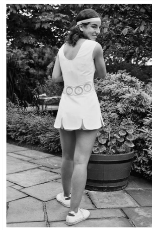
Рис. 19. Фото тенісистки Джулі Хелдман, 1971 р.