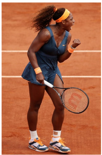
Рис. 25. Фото тенісистки Серени Вільямс, 2013 р.