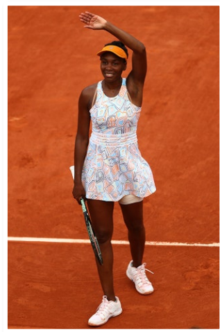
Рис. 24. Фото тенісистки Вінус Уільямс, 2016 р.

Відомо, що останні роки багато тенісисток, зокрема Серена й Вінус Вільямс, Анна Іванович дивують модну громадськість, з'являючись на турнірах у сукнях із деніму та мережива. А нейлон і спандекс забрали тенісну моду у своєму унікальному напрямку (рис. 24, 25, 26) (Наймодніші, 2024; Теніс, 2024; David, 2024).