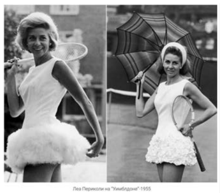
Рис. 16. Фото тенісистки Леа Периколі. Вімблдон, 1955 р.

Отже, спортсменки стали одягати короткі сукні або спідниці, вільного силуету для зручності руху, а також шорти.