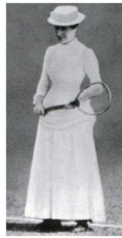
Рис. 4. Фото Мод Уотсон