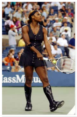
Рис. 23. Фото тенісистки Серени Вільямс, 2004 р.

лася епоха дивовижних нарядів, привертаючи до себе багато уваги яскравістю, контрастами та незвичайністю Крім того, незрівнянно посилювалася конкуренція між різними виробниками та модельєрами за те, щоб залучити до себе покупця. У цьому контексті гравці виступали своєрідними рекламними плакатами (рис. 23).