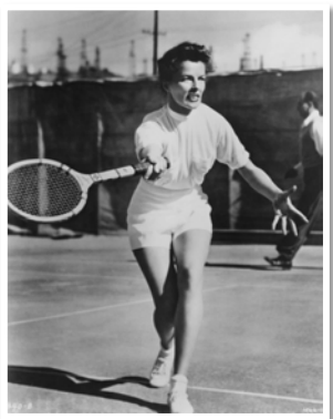
Рис. 14. Фото Кетрін Хепберн