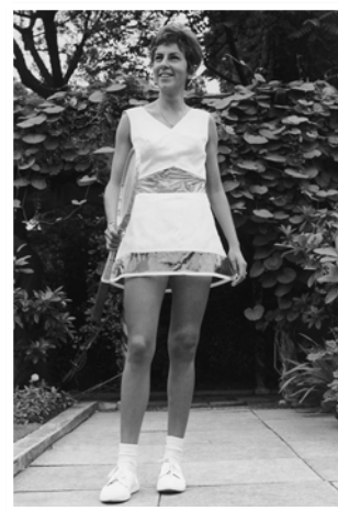
Рис. 17. Фото тенісистки Марія Буено

Отже, спортсменки стали одягати короткі сукні або спідниці, вільного силуету для зручності руху, а також шорти.