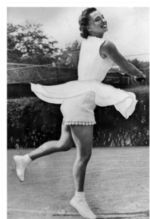
Рис. 18. Фото тенісної моди (60-ті рр.)

У 1986 р. замість білого тенісного м'яча офіційно був затверджений яскраво-жовтий, оскільки його краще було видно на кольоровому телеекрані. Телепрогрес вплинув і на моду у тенісі. Гравці відмовилися від формального білого дрес-коду і почали носити яскравіший кольоровий одяг. У цей