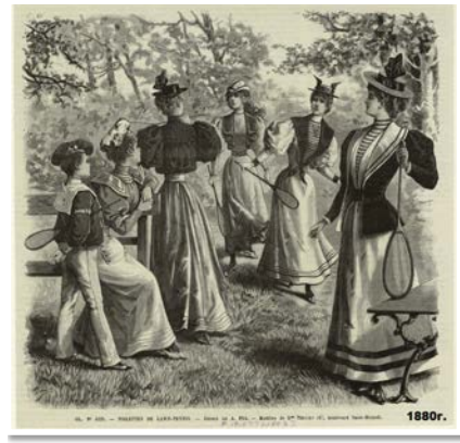
Рис. 3. Ілюстрація з журналу, 1880 р.

Як відомо, юній дівчині Лотті Дот в 1887 році Вімблдонський турнір допомогла виграти шкільна форма (рис. 5). Сукня була коротшою, ніж традиційне вбрання тенісисток того часу, що зробило його набагато зручнішим. Незабаром спортсменки почали використовувати форму вкороченого варіанта – спершу до щиколотки, потім трохи нижче коліна (Теніс, 2024).