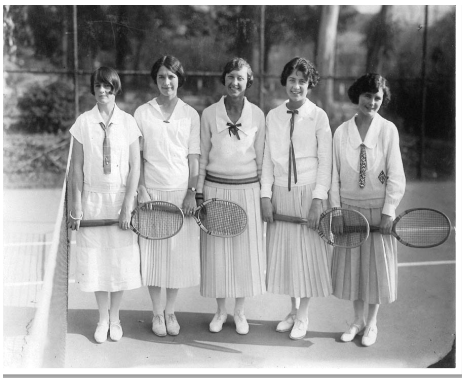
Рис. 10. Фото тенісисток, 1920 р.

У передвоєнні тривожні роки показна розкіш поступилася місцем нової елегантності. Замість розкутої жінки 20-х з'явилися образи діяльних, сильних, спортивних, водночас дуже жіночних представниць прекрасної статі, які виживають у складну епоху. В інструкції для леді того часу вказано, що на тенісному полі варто поводитися стримано, витончено, розмірено і заборонялося скрикувати при ударі по м'ячу.