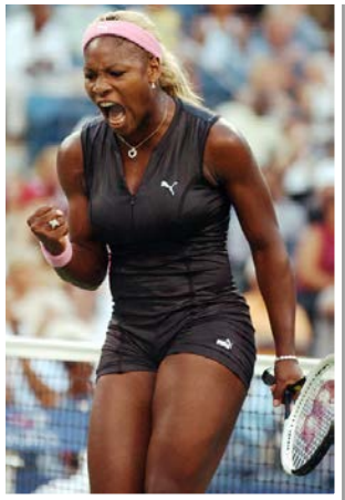
Рис. 22. Фото тенісистки Серени Вільямс, 2002 р.

У дев'яностих роках колір тенісного одягу ще більше поживавиться. Так, стали використовуватися легкі дихаючі тканини, такі як нейлон і спандекс. У 2000-ті роки основні елементи тенісної форми залишилися тими ж, що і 20 столітті, хоча нові синтетичні тканини, розвиток індустрії та завдяки засобам масової інформації привели до певних революційних змін у дизайні; відкри-