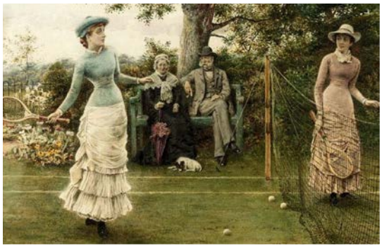
Рис. 1. Джордж Гудвін Кілберн «Гра в теніс» (1839-1924)

Поступово пишні форми почали поступатися менш витонченим. У цей період в журналах багато писалося про реформу одягу, який повинен бути зручним і просторим, не стискувати рухів і дихання, а корсети повинні бути повністю прибрані з жіночого гардеробу. З'явилися прості сукні, які називалися – сукні «реформи». Вони спадали від плеча, були досить просторі, з ледь завищеною талією (рис. 6).