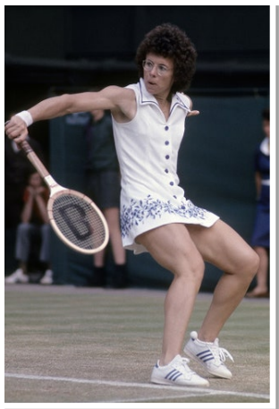
Рис. 20. Фото тенісистки Біллі Джин Кінг, 1975 р.