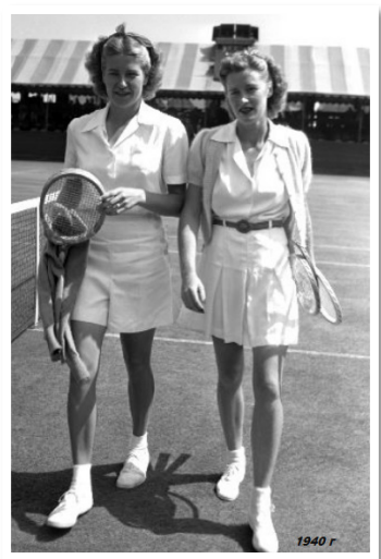
Рис. 13. Фото тенісисток, 1940 р.