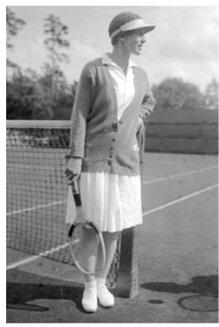
Рис. 9. Фото Хелен Віллз, 1938 р.

У XX ст. технічний прогрес призвів до масового промислового виробництва одягу, розвитку засобів комунікації. Мода стала надбанням кола суспільства. Довжина спідниць тенісисток ставала все коротшою і коротшою. На початку 1920-х років модною вважалася довжина до щиколотки, в 1924–25 рр., довжина біля коліна, а у 1930 році піднялася вище колін. Так, Сюзан Ленглен в 1919 році грала на турнірі Вімблдон у скороченій спідниці пліссе трохи нижче коліна та топі без рукавів (рис. 8). Дівчата зазнали суспільної критики – адже жінкам того часу не личило з'являтися на людях з оголеними зап'ястями і без підтримки грудей і талії. В результаті завдяки Сюзан у жіночому тенісі утвердилися спідниці до коліна та короткі рукави. Згодом таку форму було визнано найоптимальнішою для гри у великий теніс.