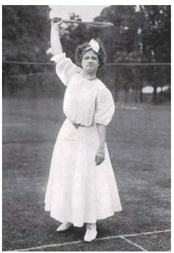
Рис. 7. Фото Мей Саттон

Обов'язкові корсети тенісних суконь спортсменок початку XX століття також були скасовані через утиск свободи рухів. Першою революційною стала Мей Саттон, яка вийшла 1905 року на корт у сорочці батька із засуканими рукавами (рис. 7).