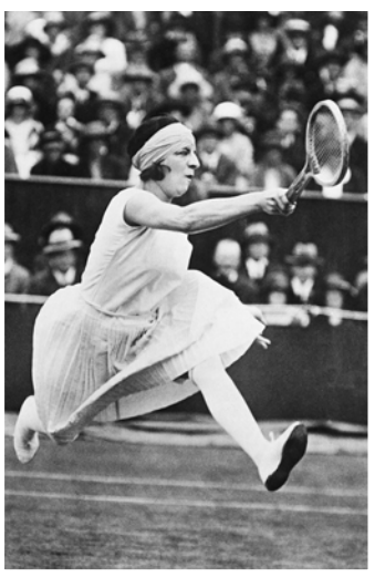
Рис. 8. Фото Сюзан Ленглен, 1919 р.