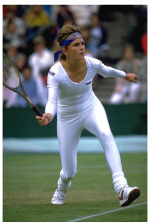
Рис. 21. Фото тенісистки Енні Уайт, 1985 р.