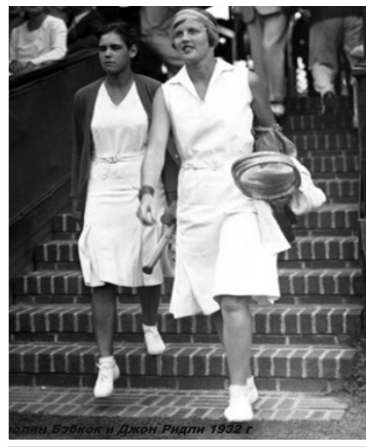
Рис. 12. Фото тенісисток Біллі Джин Кінг, 1932 р.

Однак, це не зупинило дизайнера створювати спортивну форму для тенісисток. Його наступною цікавою роботою стала сукня Леа Периколі зі спідницею з пір'їв (рис. 16) та комплект для бразильської спортсменки Марії Буено, в якому вона вийшла на корт у 1966 році. Коротка сукня була доповнена вставками (рис. 17) (Tenis, 2024; Bud, 2024).