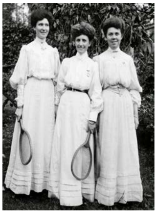
Рис. 6. Фото Тенісистки в сукнях «реформи»

Обов'язкові корсети тенісних суконь спортсменок початку XX століття також були скасовані через утиск свободи рухів. Першою революційною стала Мей Саттон, яка вийшла 1905 року на корт у сорочці батька із засуканими рукавами (рис. 7).