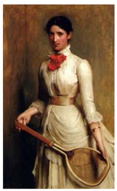
Рис. 2. Артур Хакер «Портрет невістки», (1858-1919)