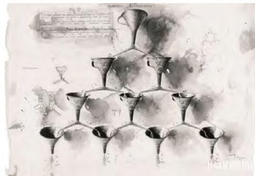
Рис. 3. Один з ескізів «Фонтану виснаження», 1995