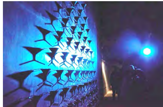
Рис. 4. Фрагмент експозиції виставки «Павло Маков. Фонтан виснаження 1994–2024». Центр сучасного мистецтва «ЄрмиловЦентр», м. Харків (2024)

збірки, фондів Музею сучасного українського мистецтва Корсаків і колекції Павла Мартинова (Рис. 4). Виставку організовано зусиллями галереї сучасного мистецтва «The Naked Room» і Центру сучасного мистецтва «ЄрмиловЦентр», за сприяння Харківського національного університету ім. В. Н. Каразіна (Павло Маков, 2022).