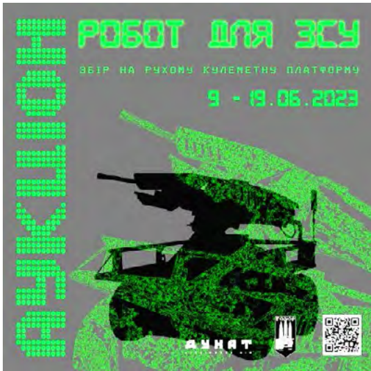
Рис. 7. Афіша благодійного аукціону «Робот для ЗСУ» (2023)

«Shum Art Gallery» (м. Львів), де на розсуд оцінювачів цієї техніки було представлено серію акварелей «Красвиди» (Рис. 8), створену відомим львівським художником Євгеном Равським в реалістичній манері на основі документальних фото з наслідками військових дій 2014 р. (Красвиди з війни ..., 2023).