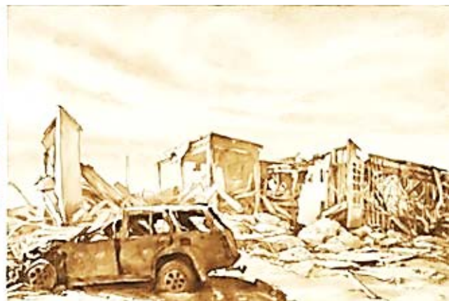
Рис. 8. Акварелі Євгена Равського, представлені на аукціоні (2023)