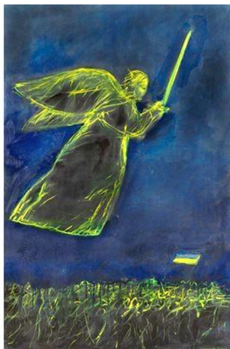
Рис. 2. Благодійний аукціон «Воєнна колекція для Музею Перемоги»: лот № 9: Владислав Шерешевський «Smoke on the water». Полотно, олія (2022); лот № 5: Матвій Вайсберг «Янгол ЗСУ». Полотно, олія (2022)