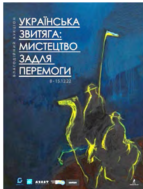
Рис. 3. Афіша благодійного аукціону «Українська звитяга: мистецтво задля перемоги» (2022)