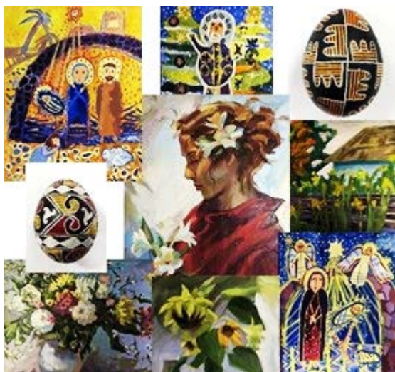
Рис. 4. Колаж із лотів благодійного аукціону на підтримку ЗСУ (США, м. Клівленд, штат Джорджія, 2023)

школи стали лотами благодійного аукціону, проведеного в США (м. Клівленд, штат Джорджія) волонтерами організації «The International Bridge Collective», які відвідали навчальний заклад в лютому того ж року. Отримані з продажу робіт (Рис. 4) кошти в сумі 4 тис. 485 дол. було спрямовано на потреби ЗСУ (Роботи учнів Луцької художньої школи..., 2023).