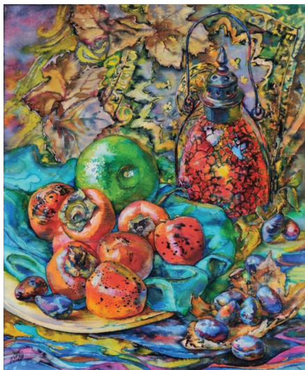
Рис. 2. Тетяна Кугай «Натюрморт з червоною лампою». Полотно, акварель, 2015