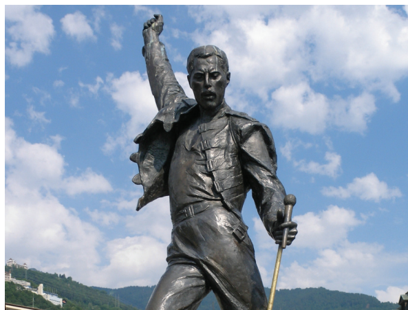
Рис. 2. Меморіальна скульптура Фредді Мерк'юрі, Ірена Седлецька (Швейцарія, Монтре, 1996)

мента, перетворивши його на своєрідний культурний феномен сучасності.