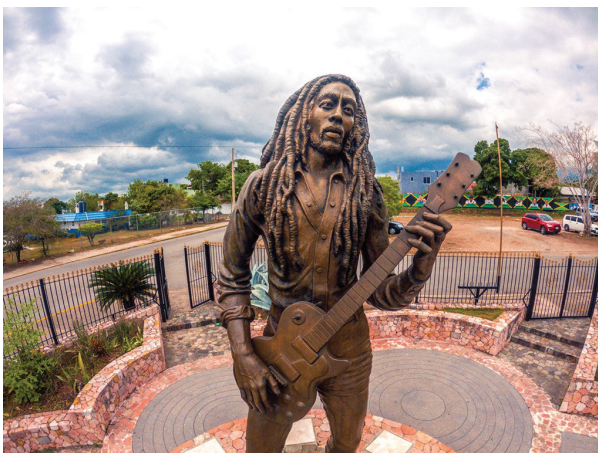
Рис. 1. Меморіальна скульптура Бобу Марлі, Елвін Толман Марріотт (Ямайка, Кінгстон, 1985)

митцем Елвіном Толманом Марріоттом ( Alvin Tolman Marriott ), стала його останньою і, за власним визнанням скульптора, найкращою роботою. Особливістю композиції є надзвичайна увага до деталей: від реалістичного відтворення знаменитих дредів музиканта до тонкого опрацювання рис обличчя та фактури одягу. Скульптура в повний зріст (168 см) зображує регі-музиканта в характерному образі – у джинсах та сорочці з довгими рукавами, з електрогітарою в руках. Бронзова поверхня виблискує золотом під карибським сонцем, створює особливий візуальний ефект, підкреслює монументальність образу. Цей пам'ятник став другою спробою увічнити пам'ять музиканта – перша сюрреалістична версія, створена Крістофером Гонзалесом ( Christopher Gonzalez ) у 1974 р., була замінена на більш реалістичну роботу Е. Марріотта через невдоволення місцевої громади ( Shooting , 2023).