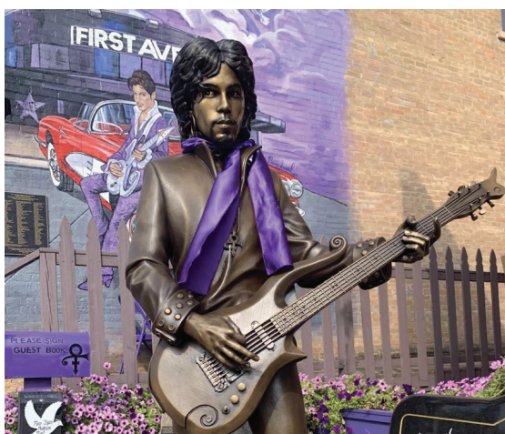
Рис. 9. Меморіальна скульптура Принсу, Brodin Studios (США, Хендерсон, Міннесота, 2020)