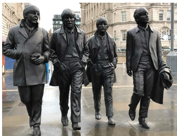
Рис. 5. Меморіальна композиція The Beatles, Енді Едвардс (Велика Британія, Ліверпуль, 2015)

Інноваційність скульптурної композиції полягає в детальному опрацюванні символічних елементів, що розкривають особистість кожного музиканта. Фігури, дещо більші за реальний розмір, зображують учасників гурту під час прогулянки – композиція базується на фотографії 1963 р., зробленій саме в цій локації. Пол Маккартні тримає фотокамеру – данина пам'яті його дружині-фотографу Лінді Маккартні. На поясі Джорджа Харрісона виکارбувано санскритський напис про медитацію та мудрість. Особливістю фігури Рінго Старра є розташування дещо позаду інших музикантів, що відтворює типове розміщення ударника на сцені, а на підшві його правого черевика зазначено поштовий код «L8» – район Welsh Streets, де він виріс. У правій руці Джона Леннона – два бронзові жолуді, відлиті зі справжніх, зібраних біля будинку The Dakota в Нью-Йорку, де музикант жив і був убитий у 1980 р. Цей елемент відсилає до його акції 1960-х років, коли він надсилав жолуді світовим лідерам як символ миру (Winter, 2021).