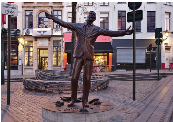
Рис. 6. Меморіальна скульптура «L'Envol», Том Франзен (Бельгія, Брюссель, 2017)

Символічним є розташування пам'ятника на площі Place de la Vieille Halle aux Blés/Oud Korenhuisplein, на тій самій вулиці, де знаходиться Фонд Бреля. Скульптурна композиція стала не лише даниною пам'яті видатному виконавцю, але й важливим елементом культурного ландшафту міста.