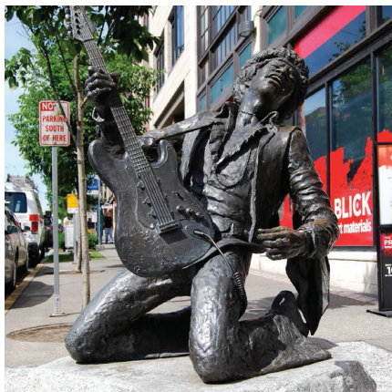
Рис. 3. Меморіальна скульптура «The Electric Lady Studio Guitar», Деріл Сміт (США, Сіетл, 1997)

«The Sound of Fury», який протягом шести років збирав кошти на встановлення пам'ятника через краудфандинг, з залученням шанувальників з різних країн світу. Скульптурна композиція спочатку розміщувалась у внутрішньому дворі колишнього Музею життя Ліверпуля, а у 2007 р. була переміщена на нове місце, що демонструє гнучкий підхід до організації культурного простору міста. Така мобільність меморіальної скульптури відповідає сучасним тенденціям адаптивного використання публічних просторів. Пам'ятник став не лише даниною пам'яті музиканту, чиї продажі альбомів конкурували з Елвісом Преслі та The Beatles, але й важливим елементом культурного ландшафту міста, що поєднує історичну пам'ять з сучасним міським життям (Billy Fury, n.d.).