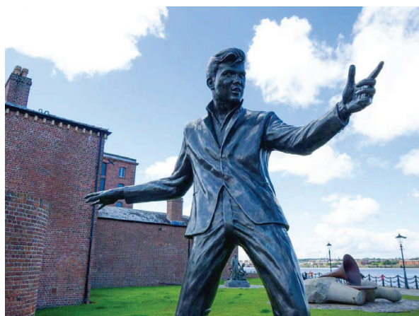
Рис. 4. Меморіальна скульптура Біллі Ф'юрі, Том Мерфі (Велика Британія, Ліверпуль, 2003)

«The Sound of Fury», який протягом шести років збирав кошти на встановлення пам'ятника через краудфандинг, з залученням шанувальників з різних країн світу. Скульптурна композиція спочатку розміщувалась у внутрішньому дворі колишнього Музею життя Ліверпуля, а у 2007 р. була переміщена на нове місце, що демонструє гнучкий підхід до організації культурного простору міста. Така мобільність меморіальної скульптури відповідає сучасним тенденціям адаптивного використання публічних просторів. Пам'ятник став не лише даниною пам'яті музиканту, чиї продажі альбомів конкурували з Елвісом Преслі та The Beatles, але й важливим елементом культурного ландшафту міста, що поєднує історичну пам'ять з сучасним міським життям (Billy Fury, n.d.).