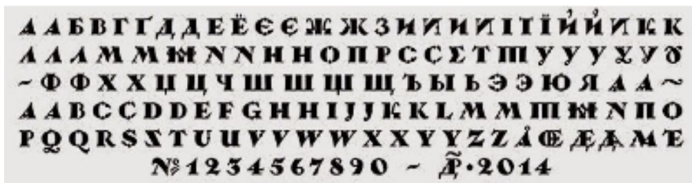
Рис. 7. Шрифт «Нарбуторум». Д. Растворцев, 2014 р.

Нарбутівський шрифт залишається актуальним і широко використовується в Україні, зокрема для оформлення більшості державних документів (Тріфонова, 2016). Авторський шрифт «Narbut» також здобув популярність серед графічних дизайнерів усього світу. Його варіації доступні на платформі Rentafont (Шрифти «Нарбут», 2025). На цій платформі представлено роботи сучас-