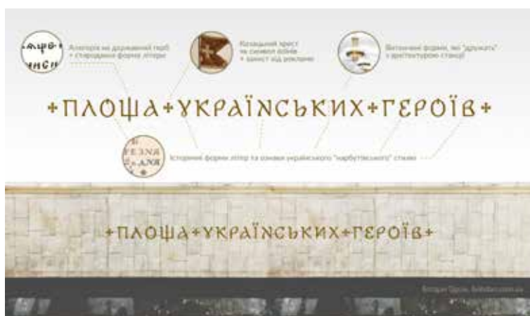
Рис. 11. Станція метро «Площа українських героїв» (надпис). Шрифт Б. Гдаля, 2024 р.