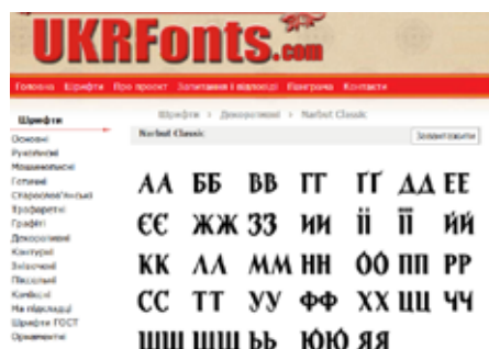
Рис. 8. Шрифт NarbutClassic Г. Заречнюка (платформа Ukrfonts.com)