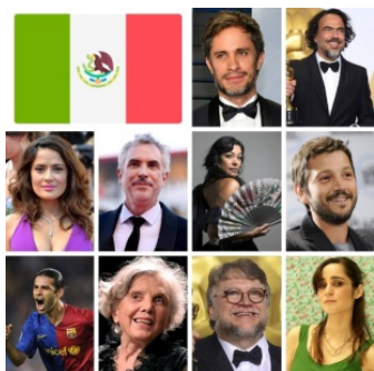
Завдання “Famosos mexicanos”

Задля набуття знань про відому персоналію варто натиснути на ім'я й прізвище – з'явиться її біографія, текст якої треба заповнити пропусками – дієсловами в pretérito indefinido (граматична компетентність як цільова для формування). Після чого пропонуються міні-аудіотексти, зміст яких треба співвіднести із зображенням персоналії (аудитивна компетентність як цільова для формування). Цікаво, що представлений у завданні “Famosos históricos en la película de Coco” список відомих персоналії налічує дев'ять осіб, а у списку Вікіпедії їх дванадцять: Frida Kahlo; la pintora; Diego Rivera; el pintor; Emiliano Zapata; el revolucionario; Adela Velarde Pérez; la revolucionaria; Agustín Lara; el compositor y cantante; Dolores del Río; la actriz; Mario Moreno “Cantinflas”; el actor y comediante; Pedro Infante; el actor y cantante; María Félix; la actriz; El Santo; el luchador y actor; Jorge Negrete; el actor y cantante.