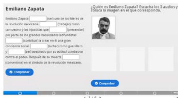
Завдання “Famosos históricos en la película de Coco”

Завдання “Ofrenda de la familia Rivera” передбачає перевірку знань тематичних лексичних одиниць. Натиснувши на різнокольорові кульки поруч із предметами вівтаря, із запропонованих лексичних одиниць треба обрати правильну (представлена на зеленому фоні). У разі неправильного виконання завдання лексична одиниця представлена на рожевому фоні. Умовою успішного виконання завдання слугує компетентність у техніці читання на рівні ізольованих слів і словосполучень.