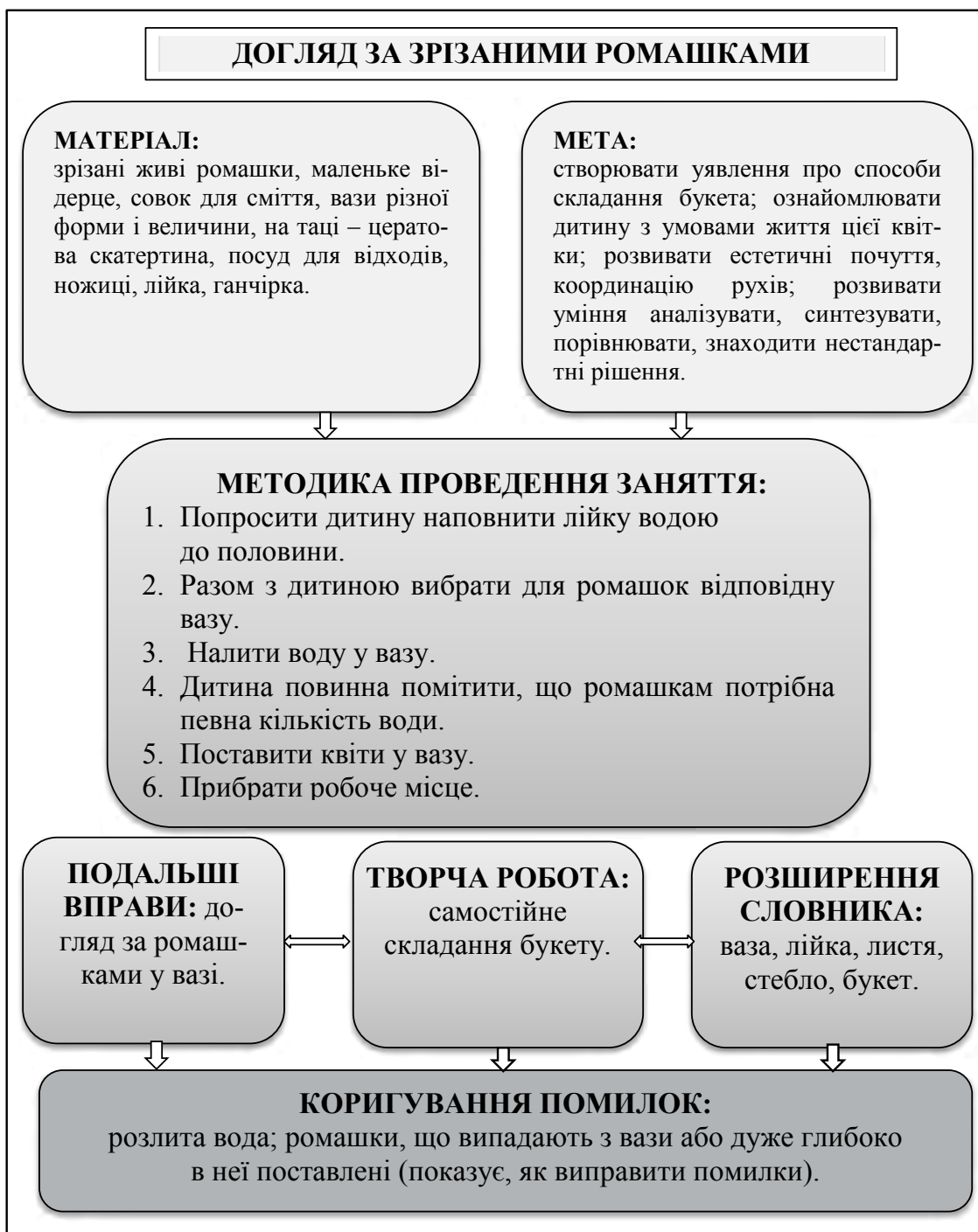
Рис. 1. Опорна схема заняття № 1

Проаналізувати ефективність впливу даного матеріалу на розвиток творчого мислення в про-