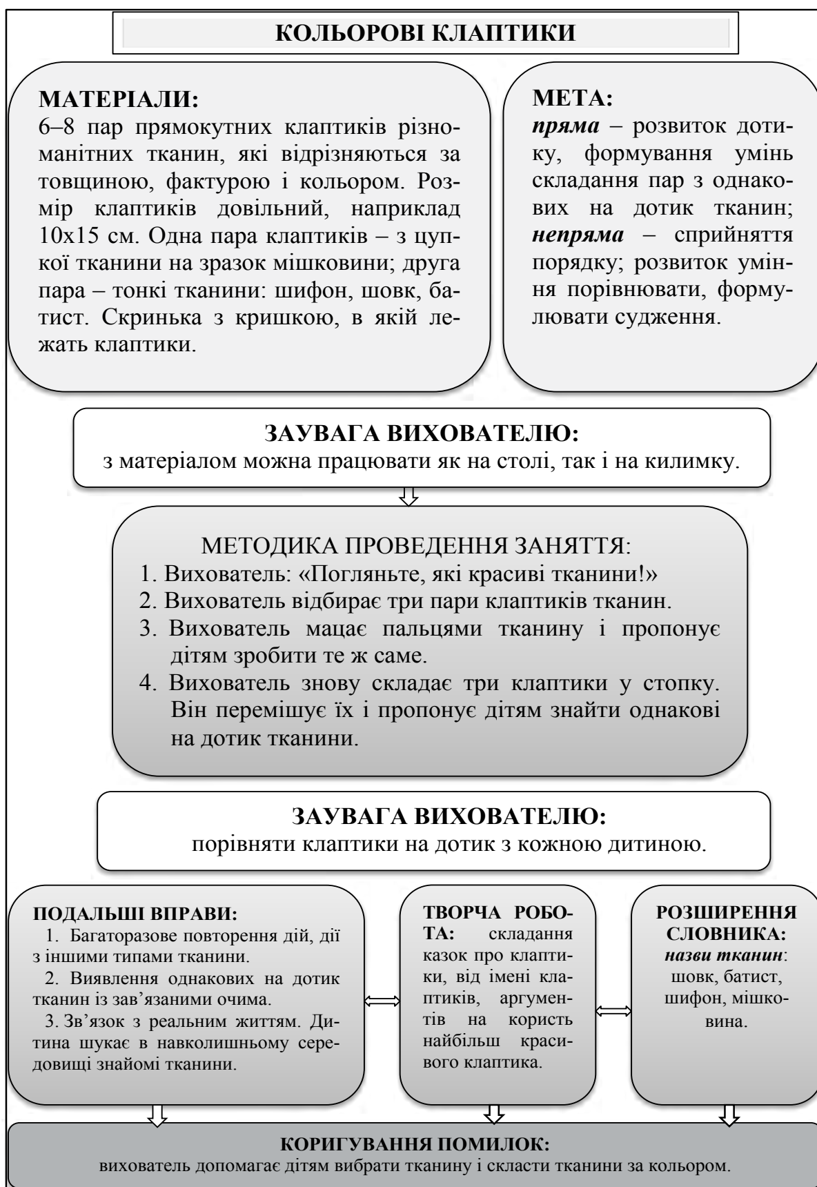
Рис. 2. Опорна схема заняття № 2