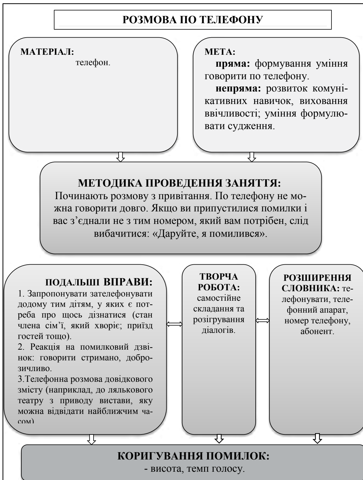
Рис. 5. Опорна схема заняття № 5

З метою вивчення мислення та творчого мислення ми проаналізували роботи таких вчених, як