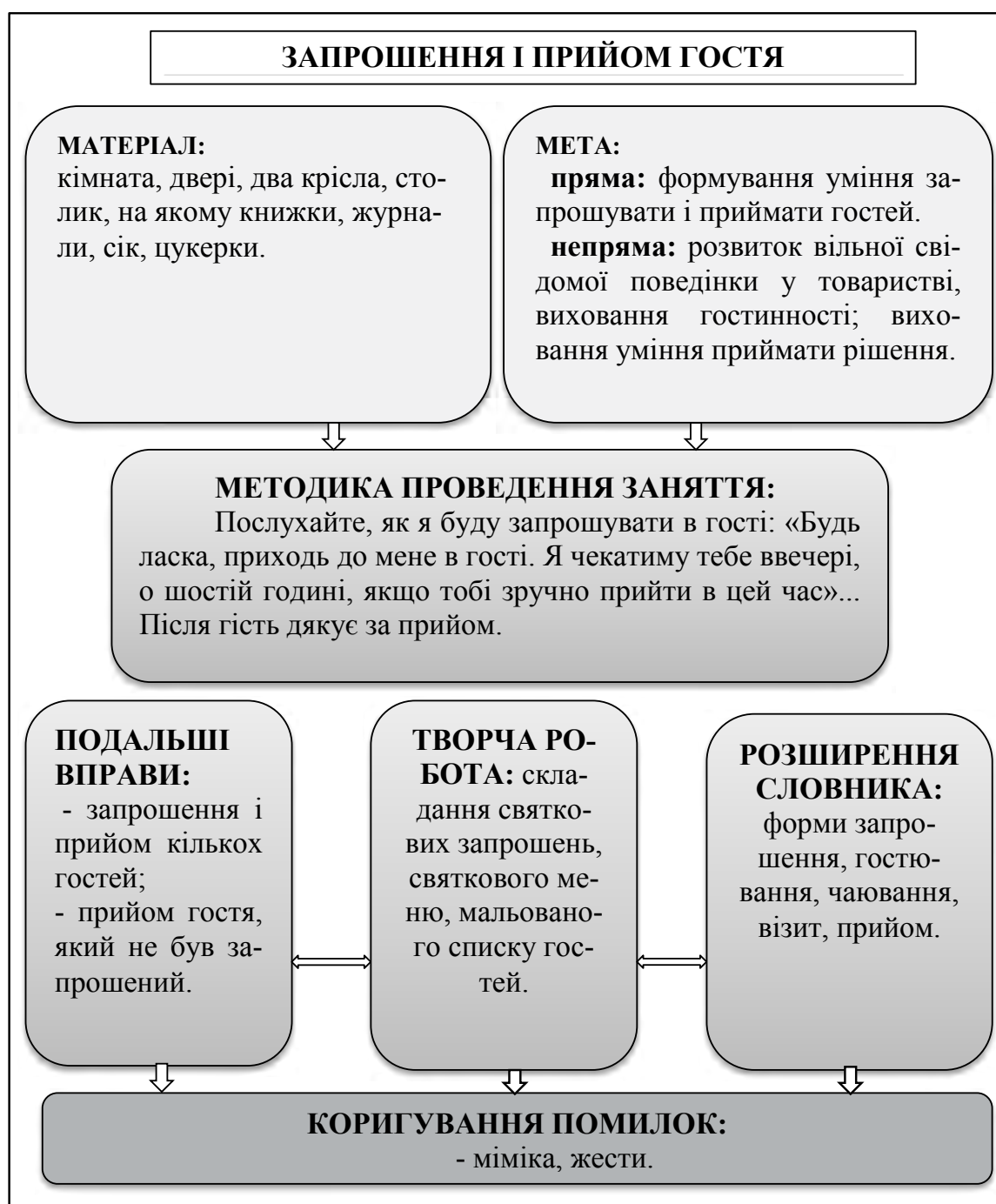
Рис. 6. Опорна схема заняття № 6

У пізнавальній діяльності людини має місце єдність чуттєвого і розумового, або раціонального, відображення об'єктивної дійсності. Як було доведено практично, відчуваючи, сприймаючи і уявляючи навколишні предмети і явища, ми при цьому вже мислимо, називаємо їх. Думаючи, ми відчуваємо, сприймаємо або уявляємо об'єкти, до яких стосуються наші думки. У пізнавальній діяльності людини мають місце постійні переходи