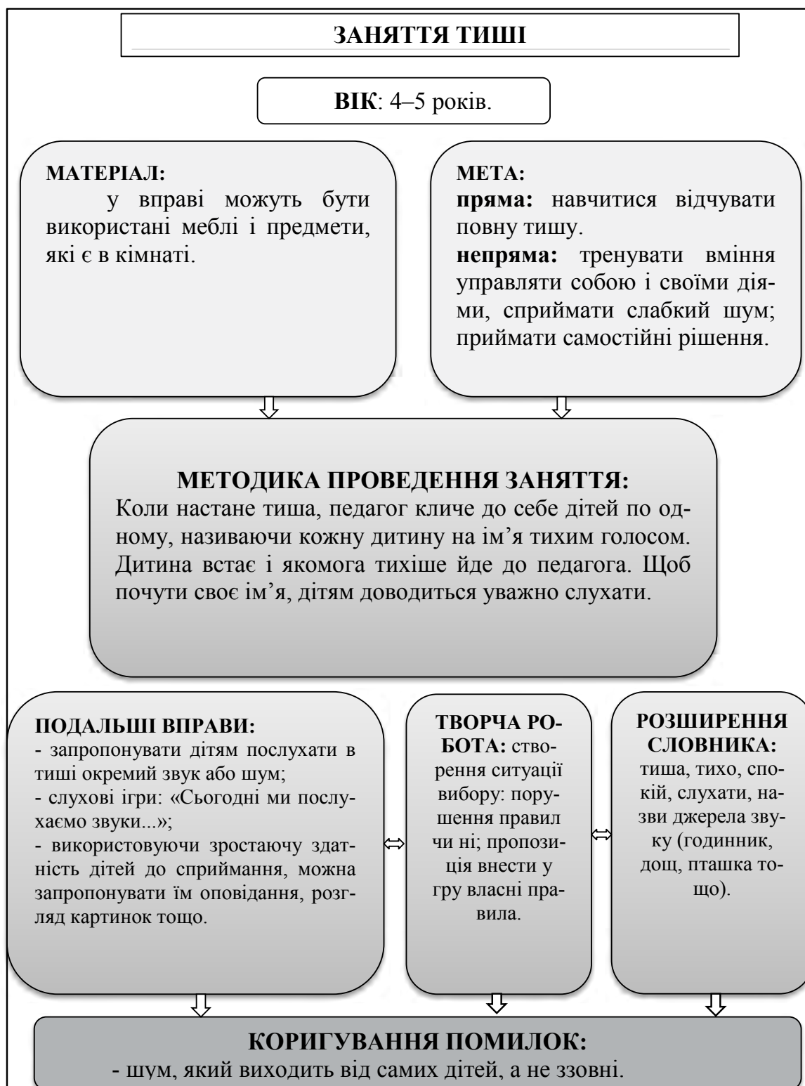
Рис. 4. Опорна схема заняття № 4

вони виявляються, їх відчувати, сприймати й уявляти. Ще античні мислителі, зокрема Аристотель, вважали, що «той, хто не відчуває, той нічого не пізнає і не розуміє; коли він що-небудь пізнає, то треба, щоб він пізнав це також і через уявлення» (Запорожец, 1978: 195). Ця думка знайшла своє