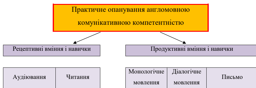
Рис. 1. Складники практичного опанування англомовної комунікативної компетентності

Для визначення об'єктивного стану сформованості англомовної комунікативної компетентності у студентів вищезгаданої спеціальності нами проведено аналіз їхньої успішності за допомогою засобів тестування, результати якого подано у таблиці 1.