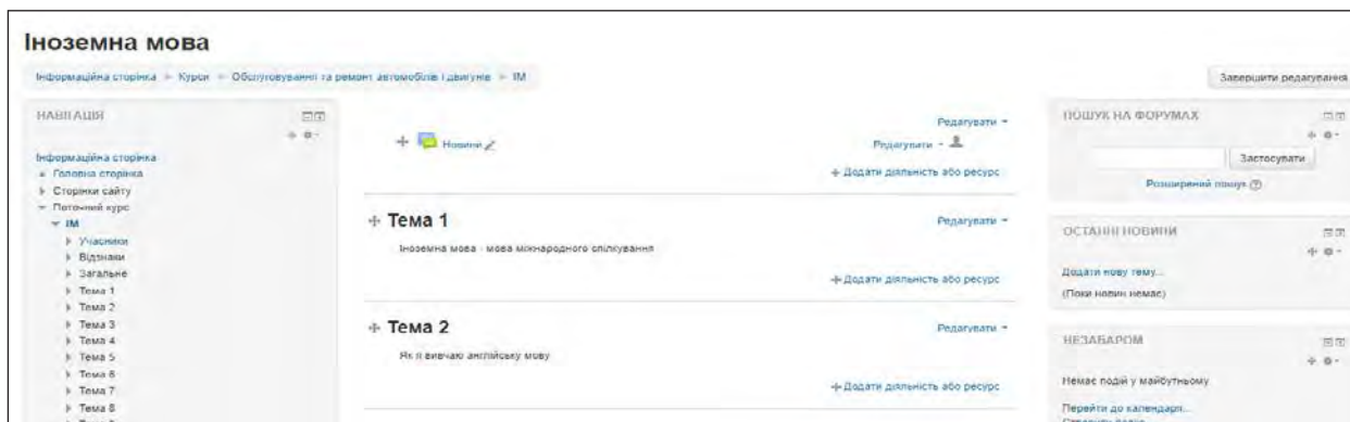
Рис. 3. Розроблення дистанційного курсу